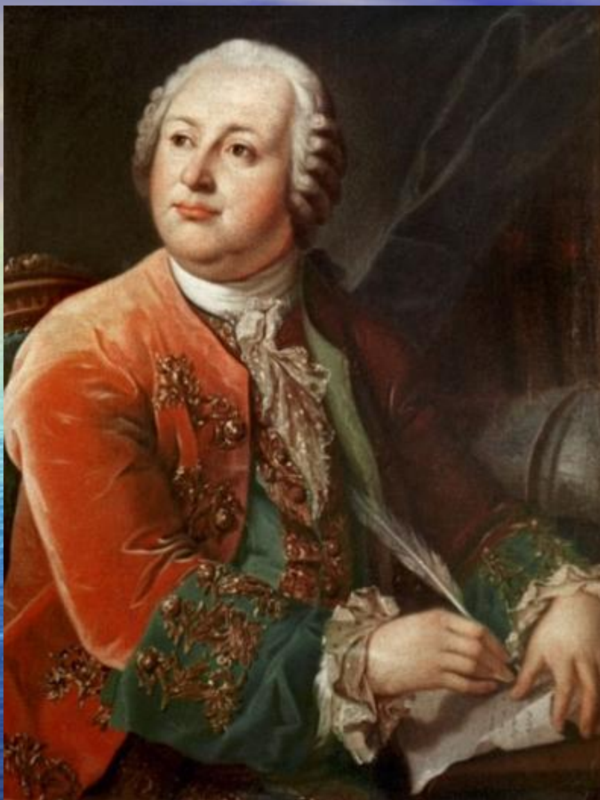
Михаил Васильевич Ломоносов (1711-1765)