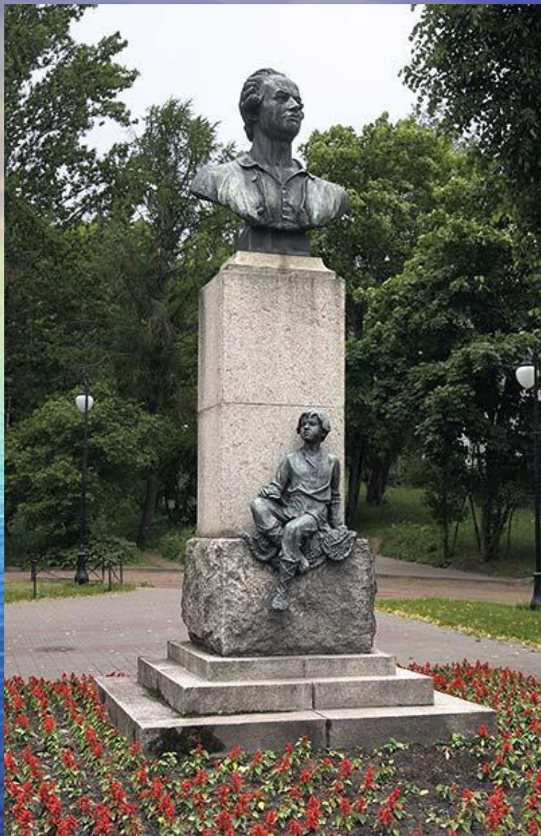
Памятник М.В. Ломоносову в г. Ломоносове (скульптор Г.Д. Гликман)