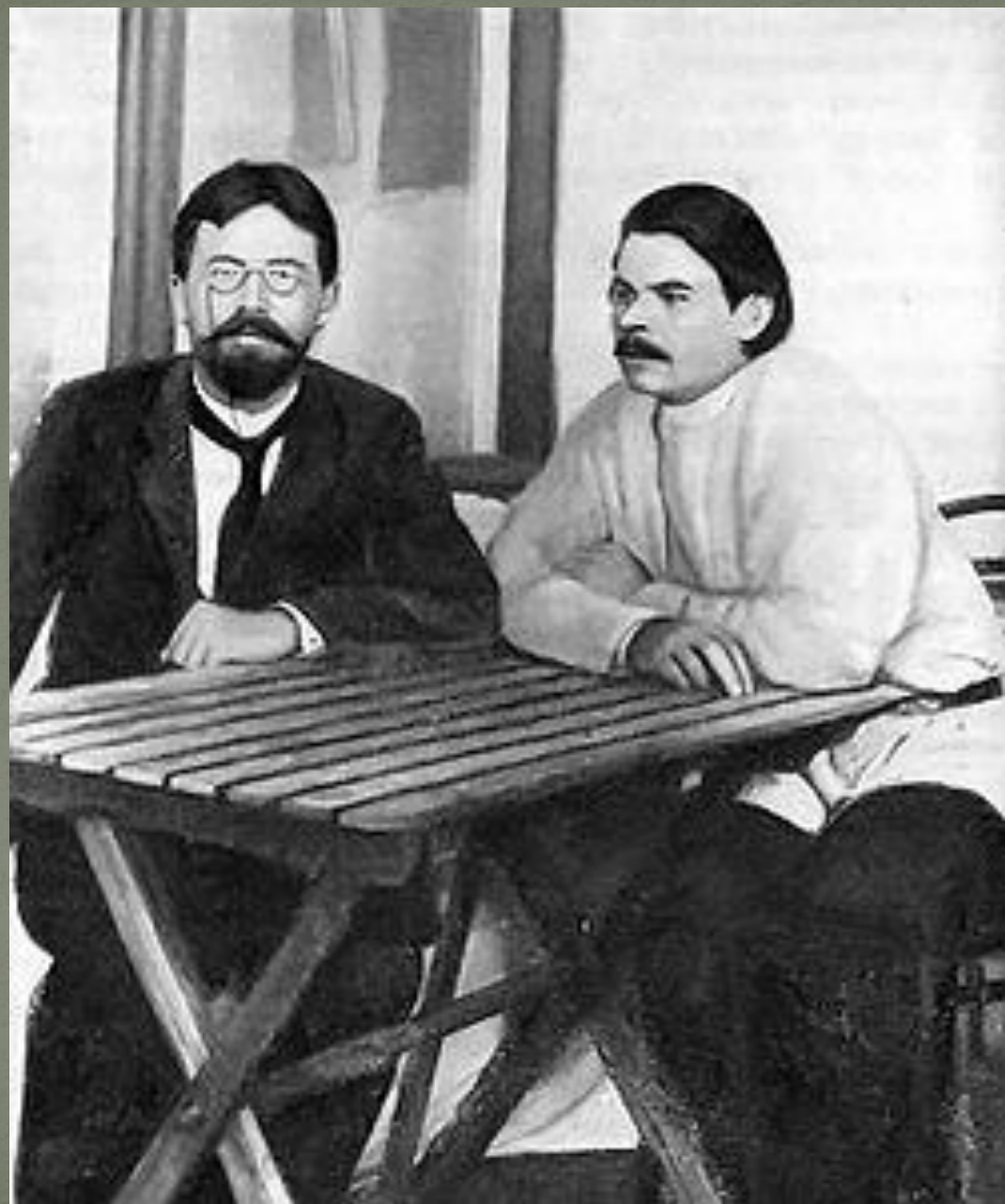
А.П.Чехов и М. Горький, 1902 год