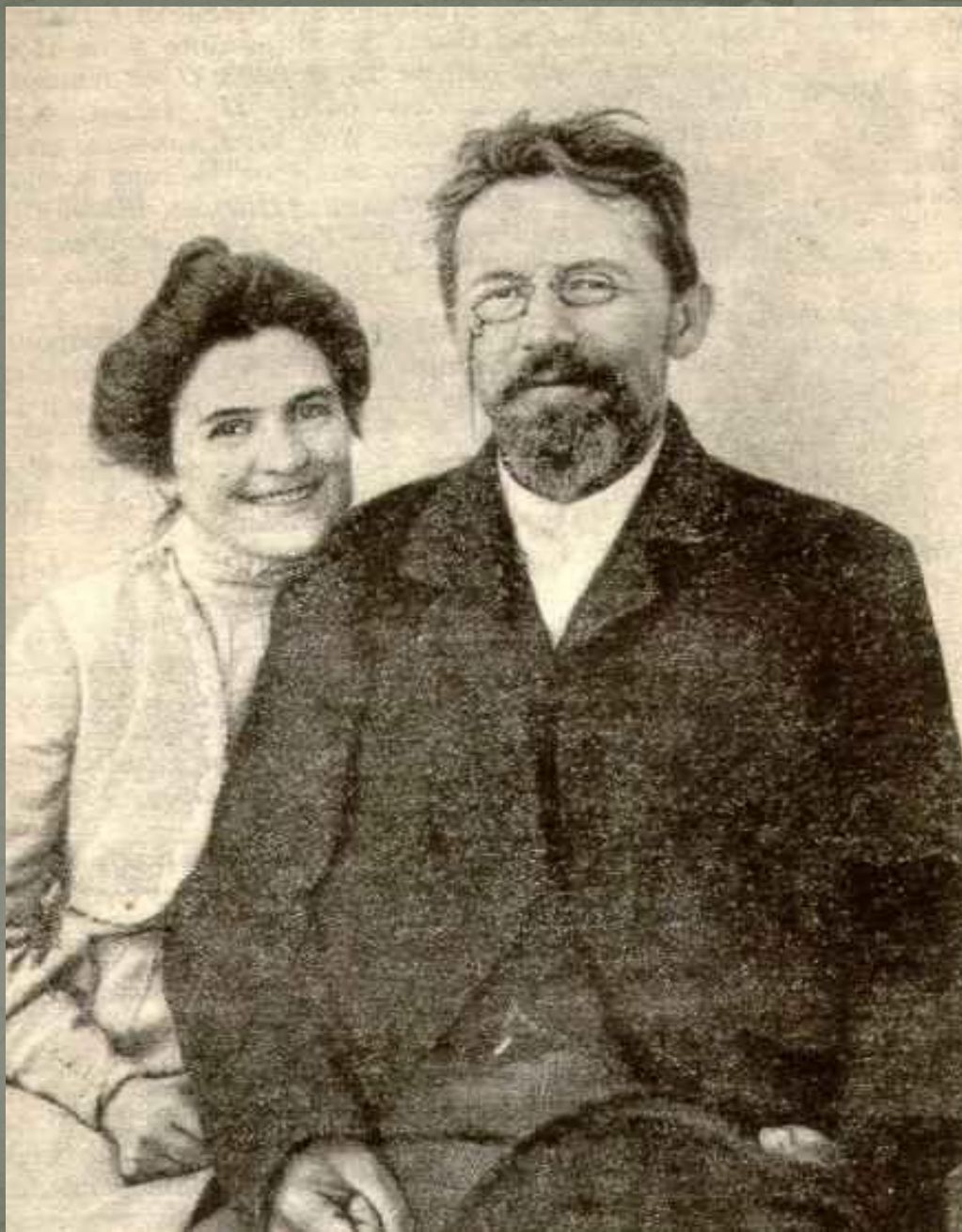
Чехов и Ольга Книппер, 1901 год