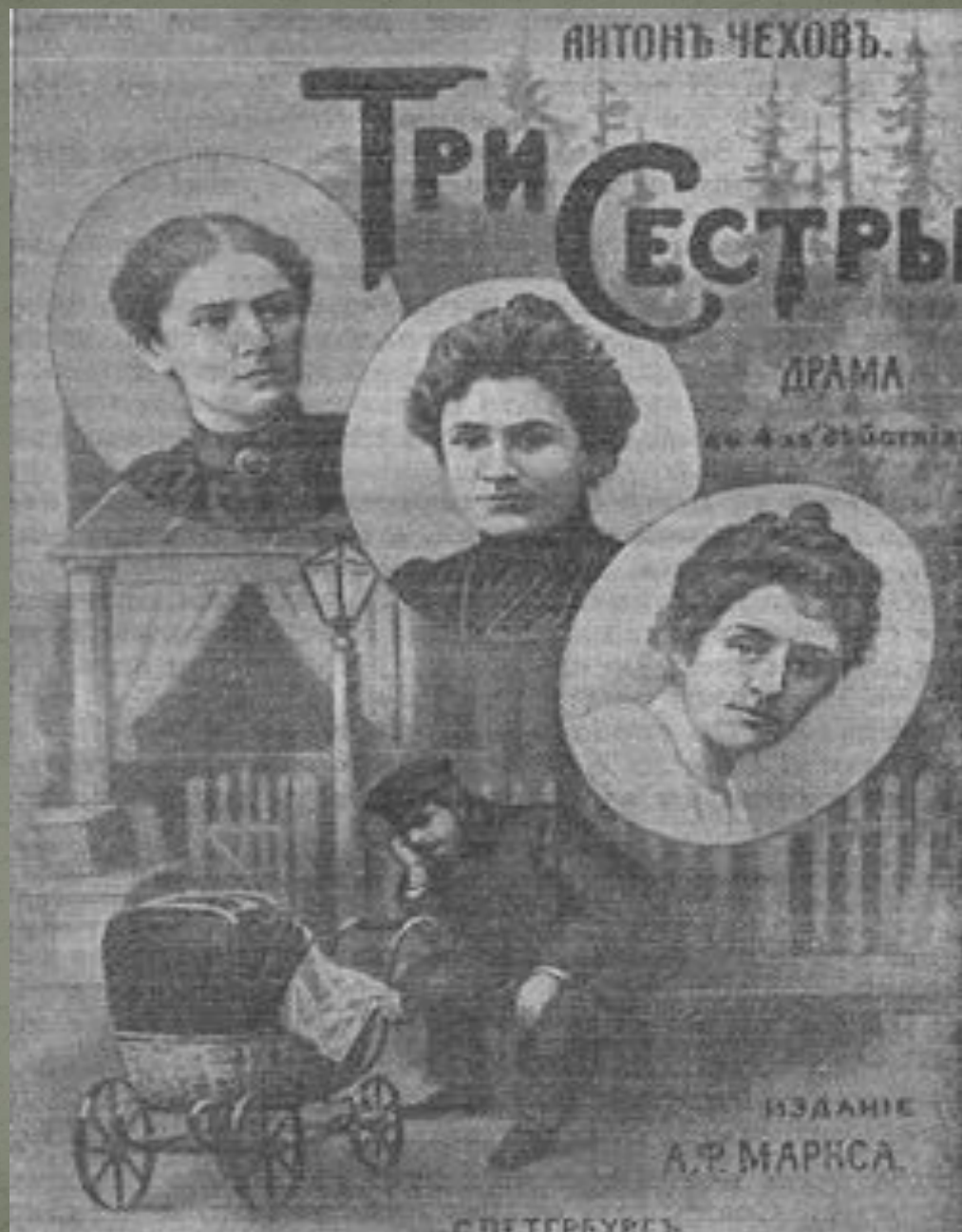
Обложка первого отдельного издания пьесы «Три сестры» (1901 год)