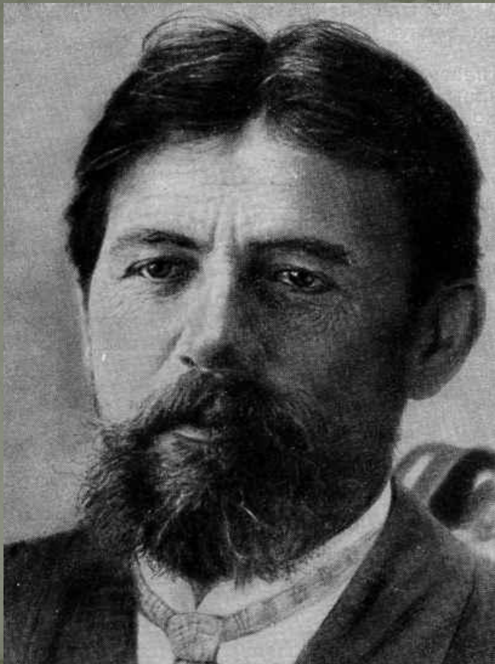
Последняя фотография, 1904 год