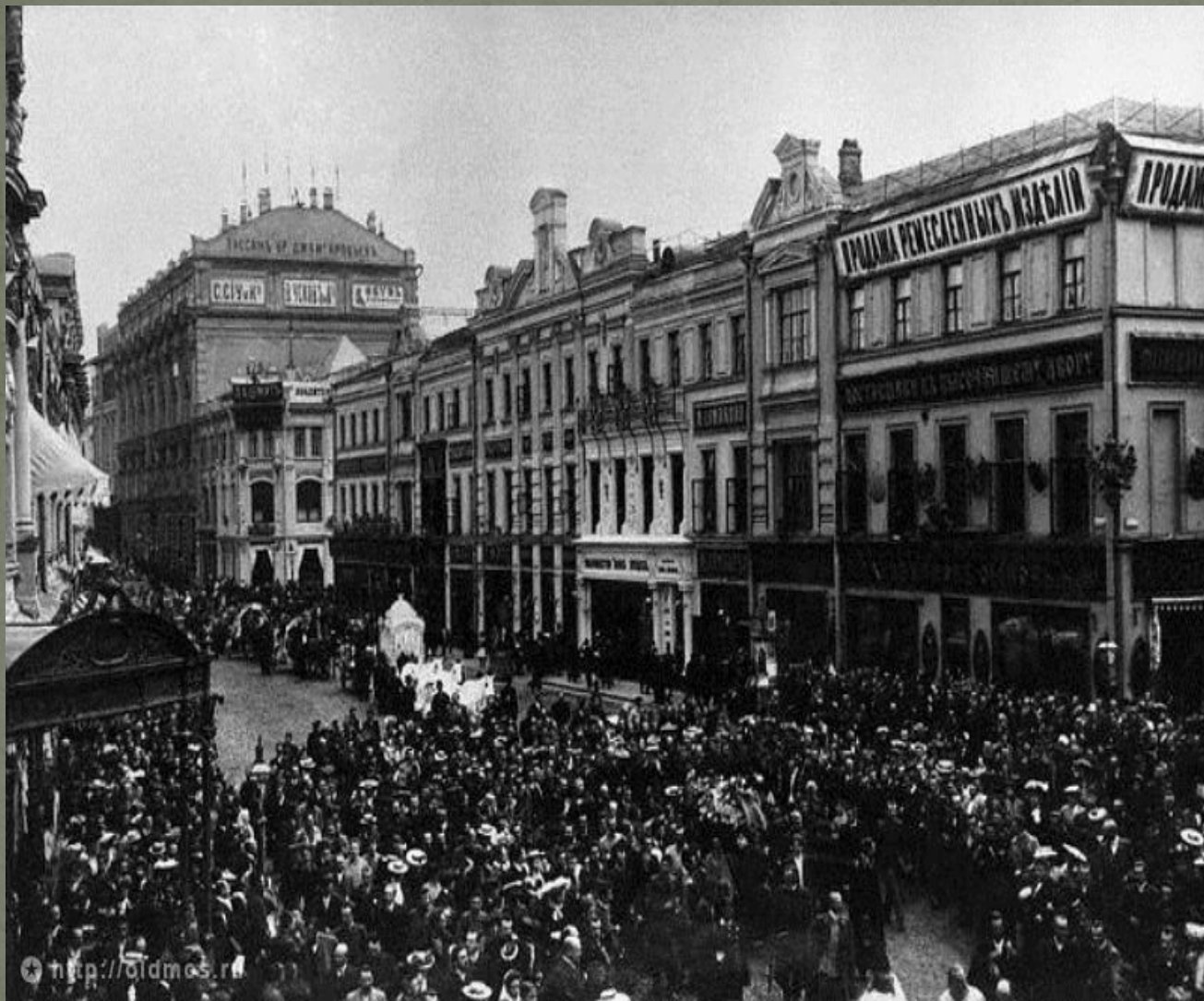
Похороны А. П.Чехова в Москве