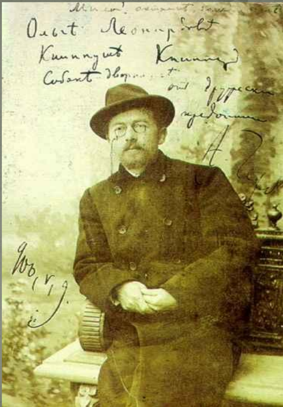
Ялта, ноябрь 1899 года