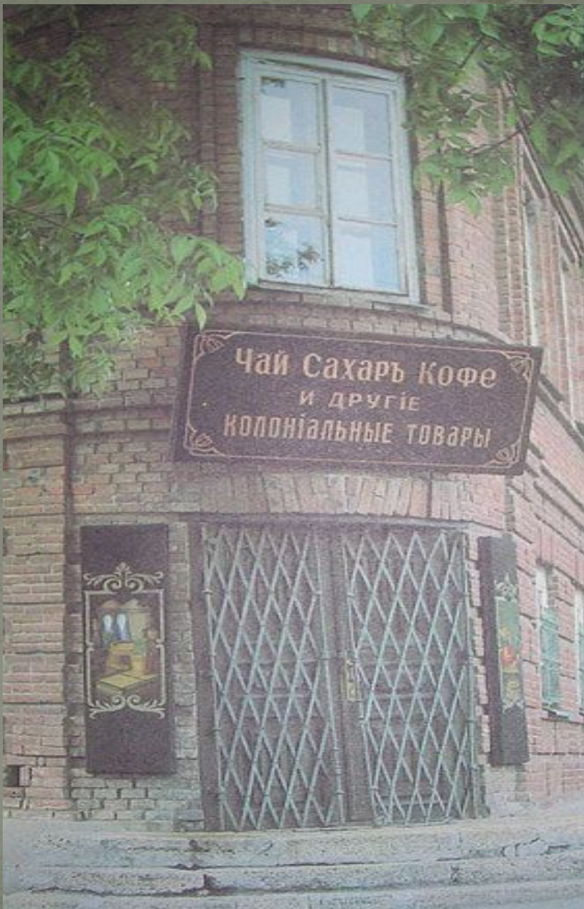
Лавка Чехова в Таганроге. Современный вид