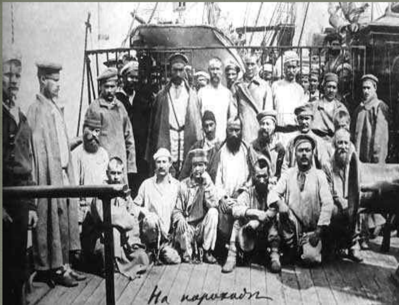
На пароходе. Путешествие на Остров Сахалин