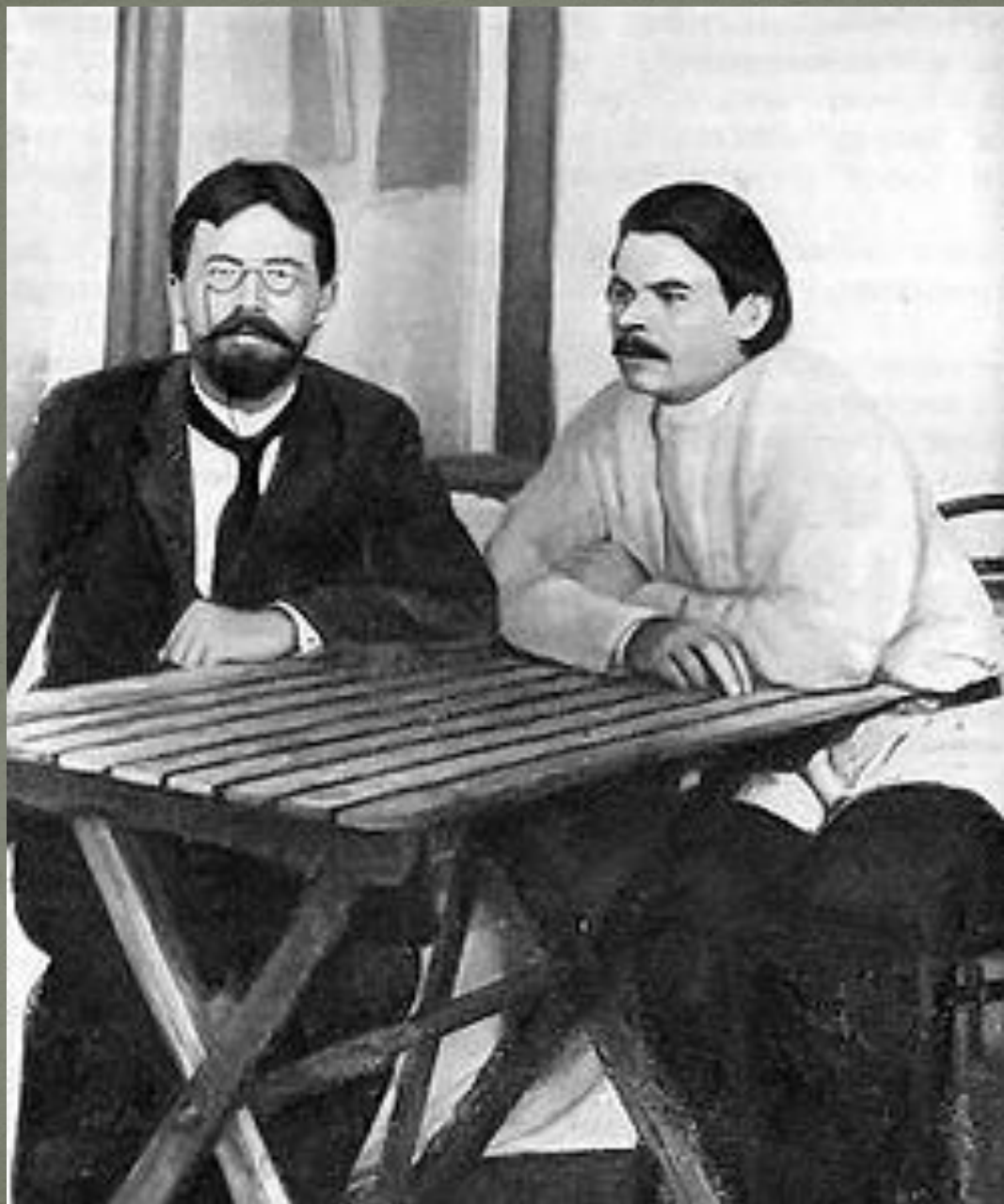
А.П.Чехов и М. Горький, 1902 год