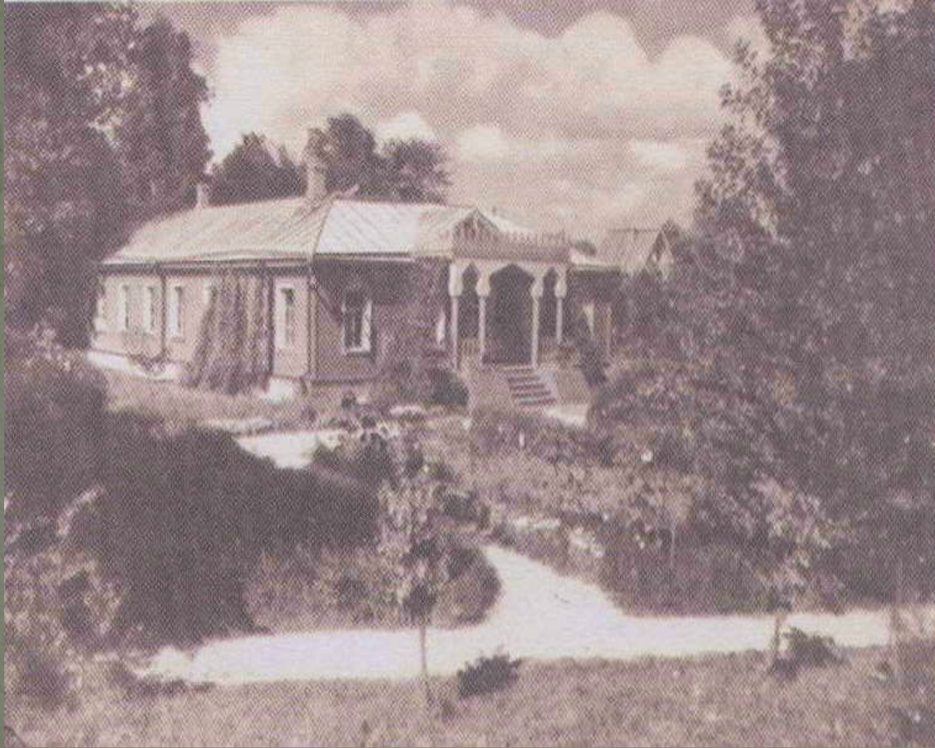
Усадьба Мелихово Серпуховского уезда Московской губернии