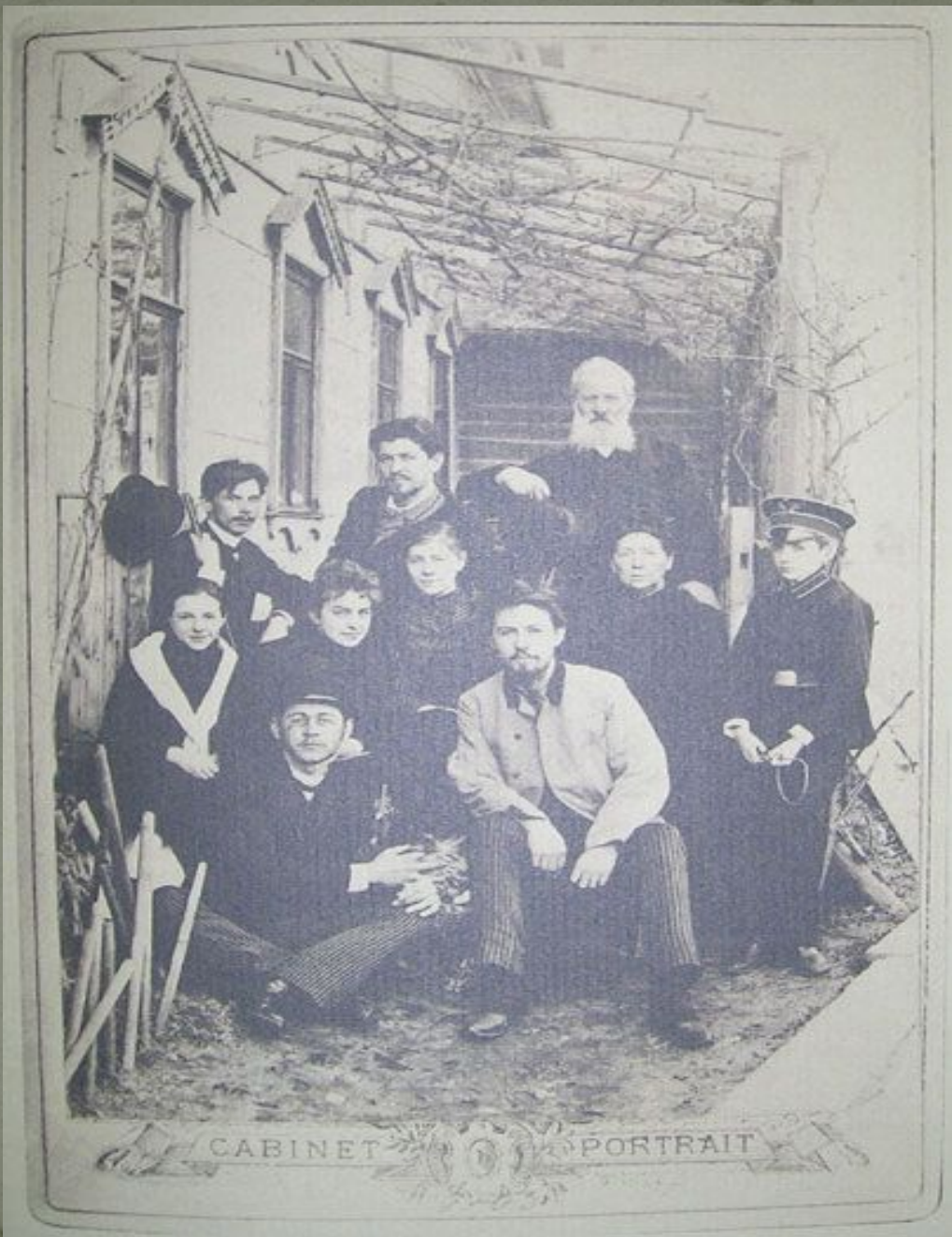
Антон Чехов с родными и друзьями перед отъездом на Сахалин