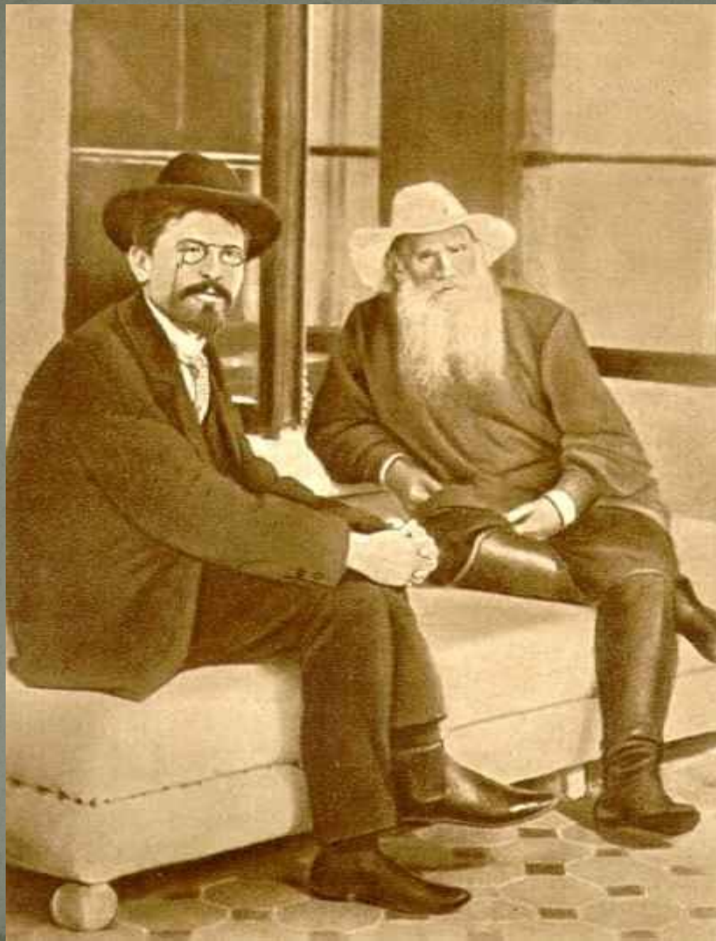
А.П.Чехов и Л.Н.Толстой, 1901 год