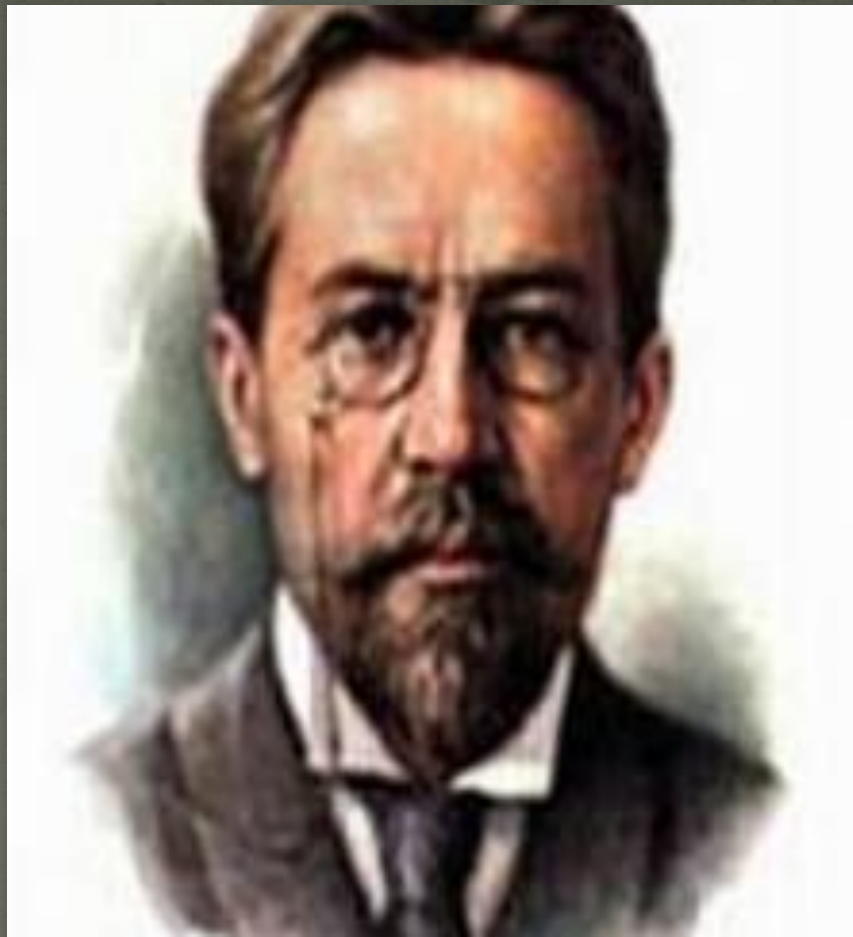
Антон Павлович Чехов (1860-1904)

2010 год – 150 лет со дня рождения писателя