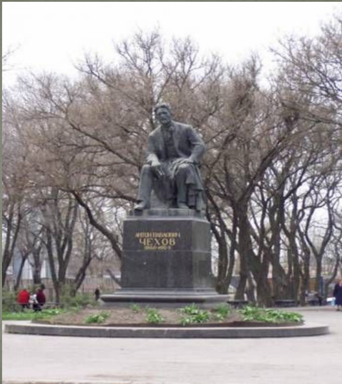
Памятник Чехову в Таганроге