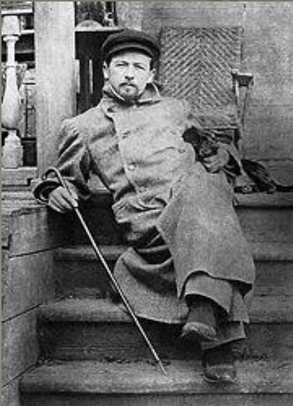
Чехов в Мелихове с таксой Хиной в 1897 году