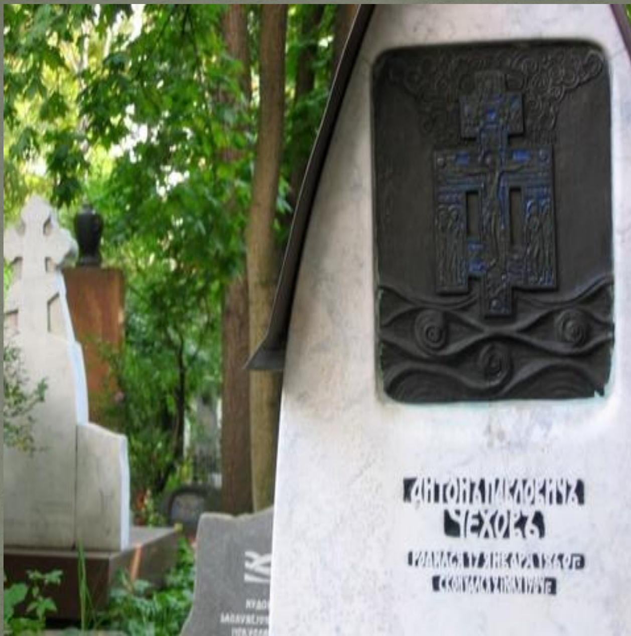
Могила Чехова на Новодевичьем кладбище в Москве. Современный вид