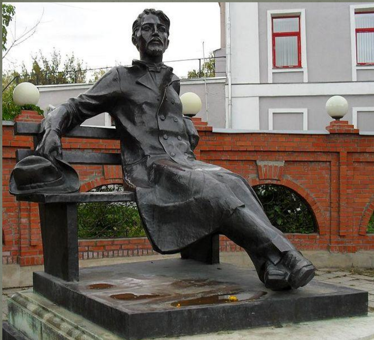
Памятник Чехову в Серпухове