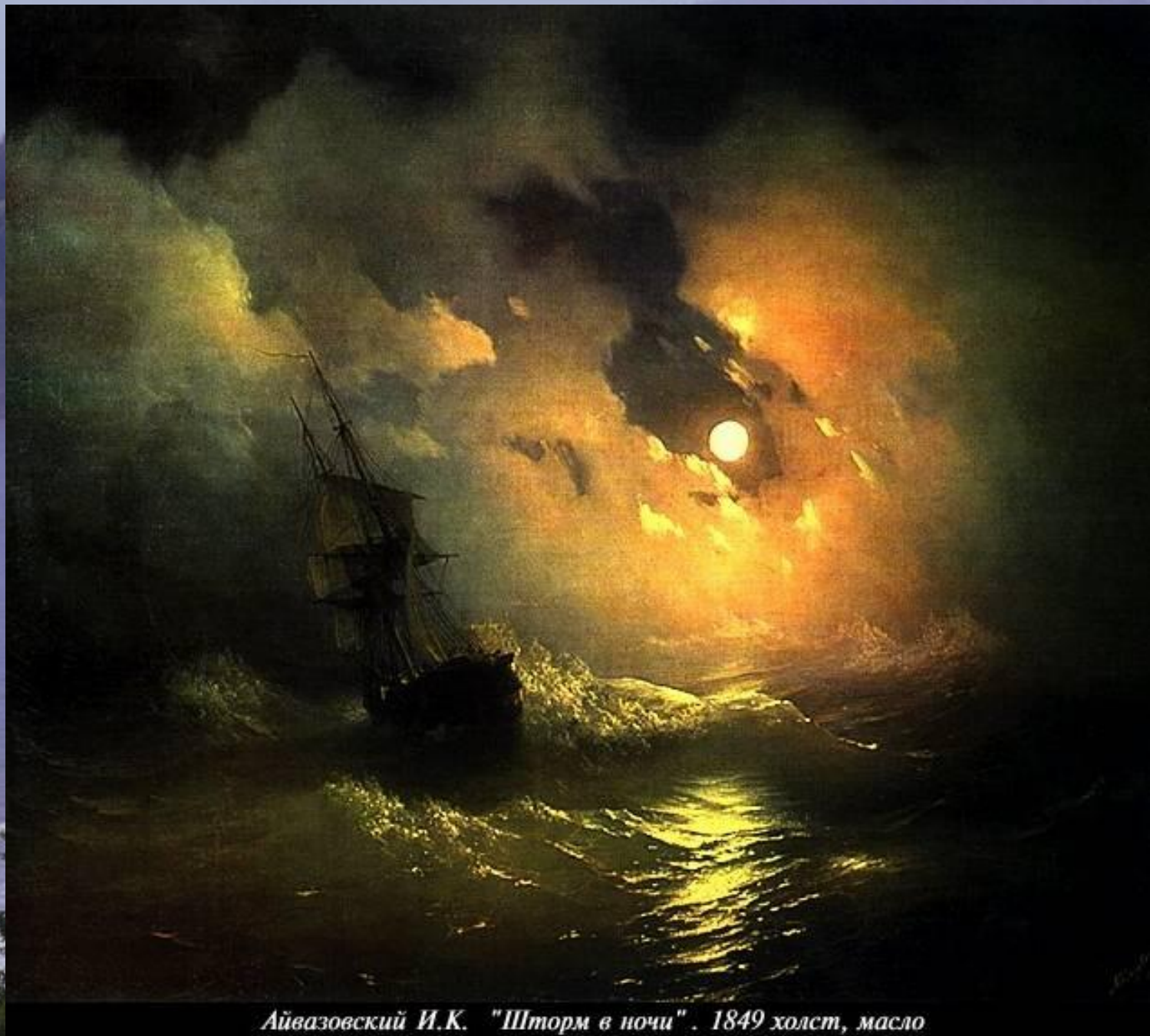
Айвазовский И.К. "Шторм в ночи". 1849 холст, масло