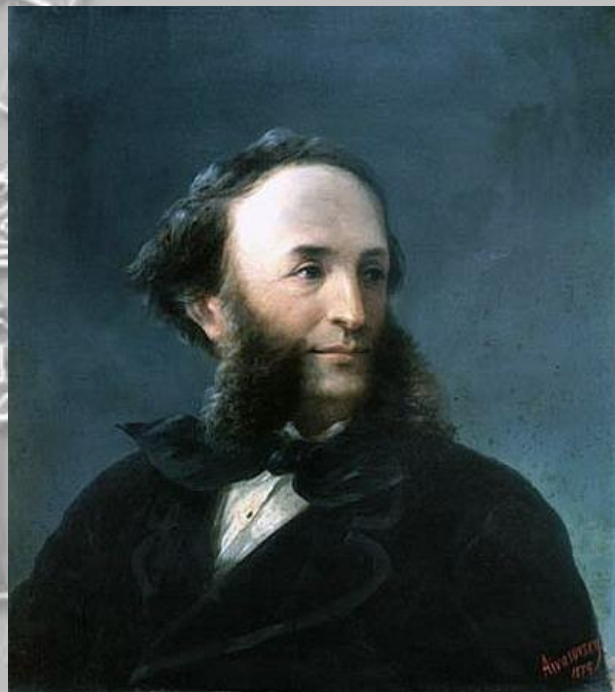
Иван Константинович Айвазовский