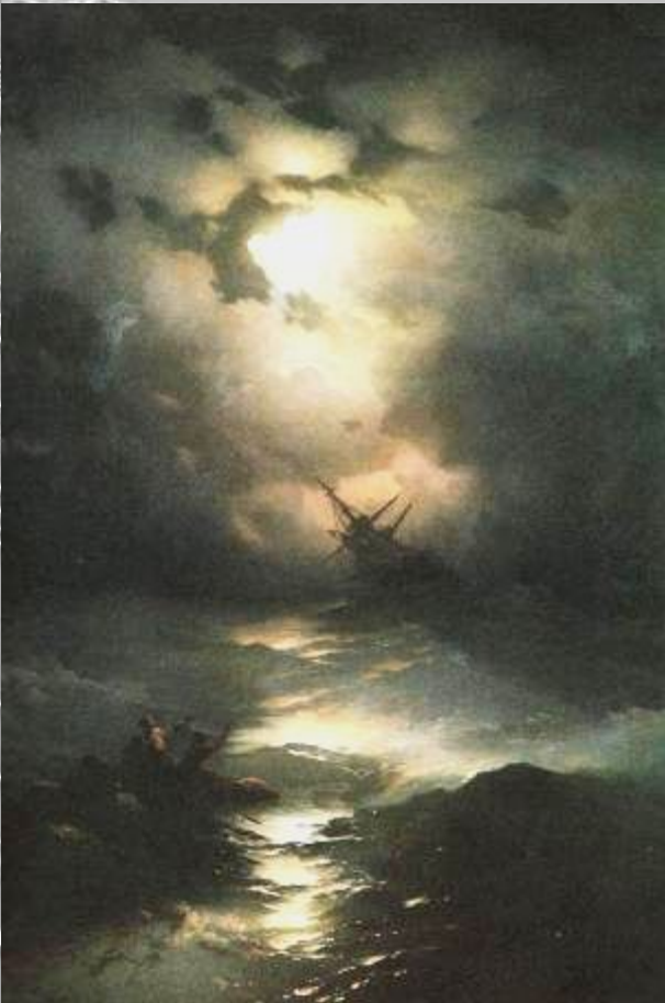
И. К. Айвазовский «Буря на Северном море»