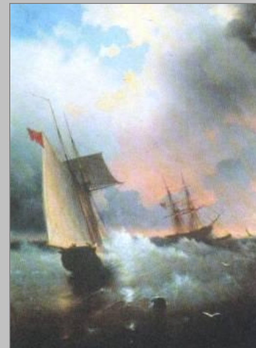
И. К. Айвазовский «Парусник»