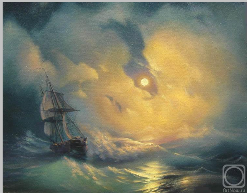
И. К. Айвазовский «Буря на море»