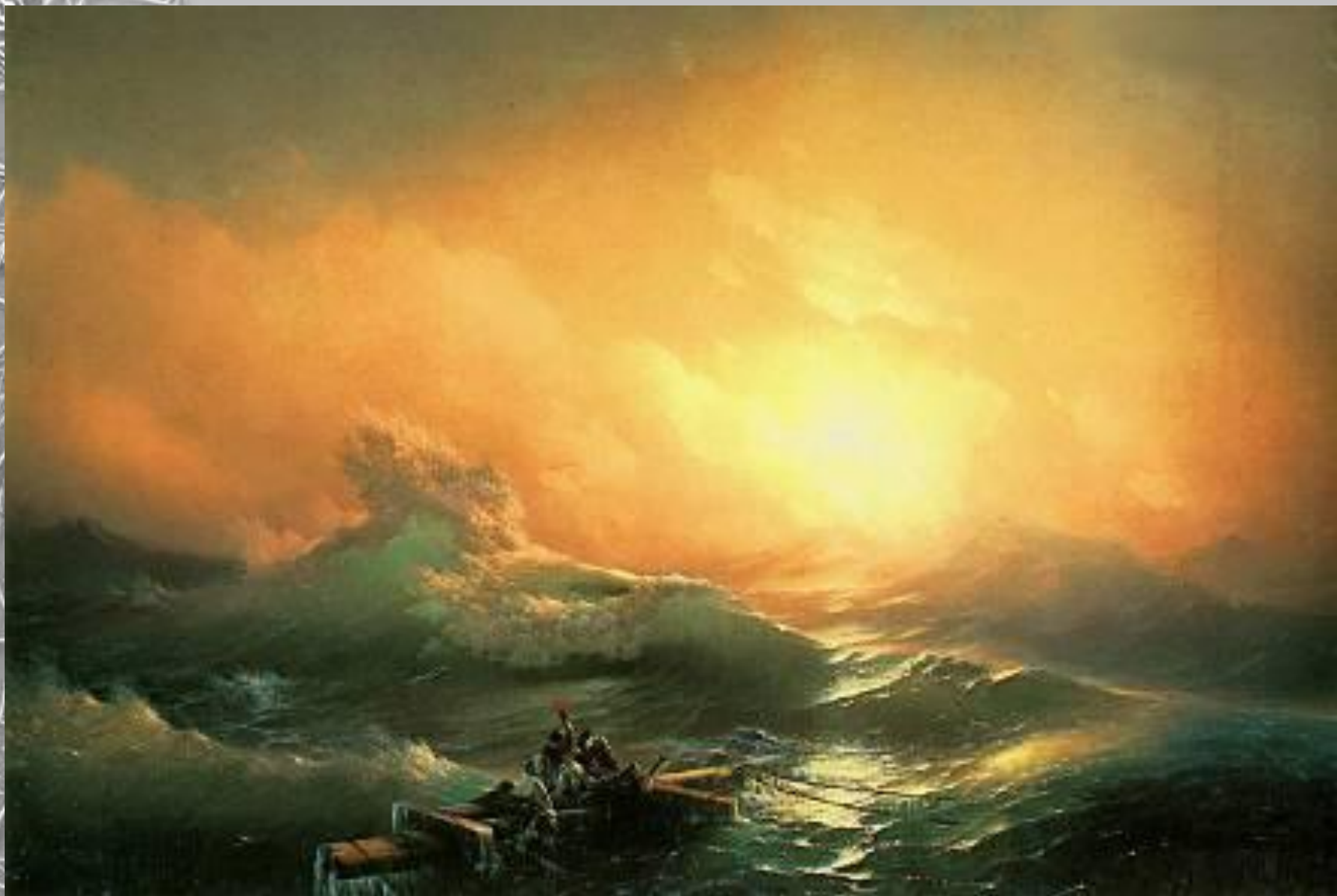
И.К.Айвазовский «Девятый вал»