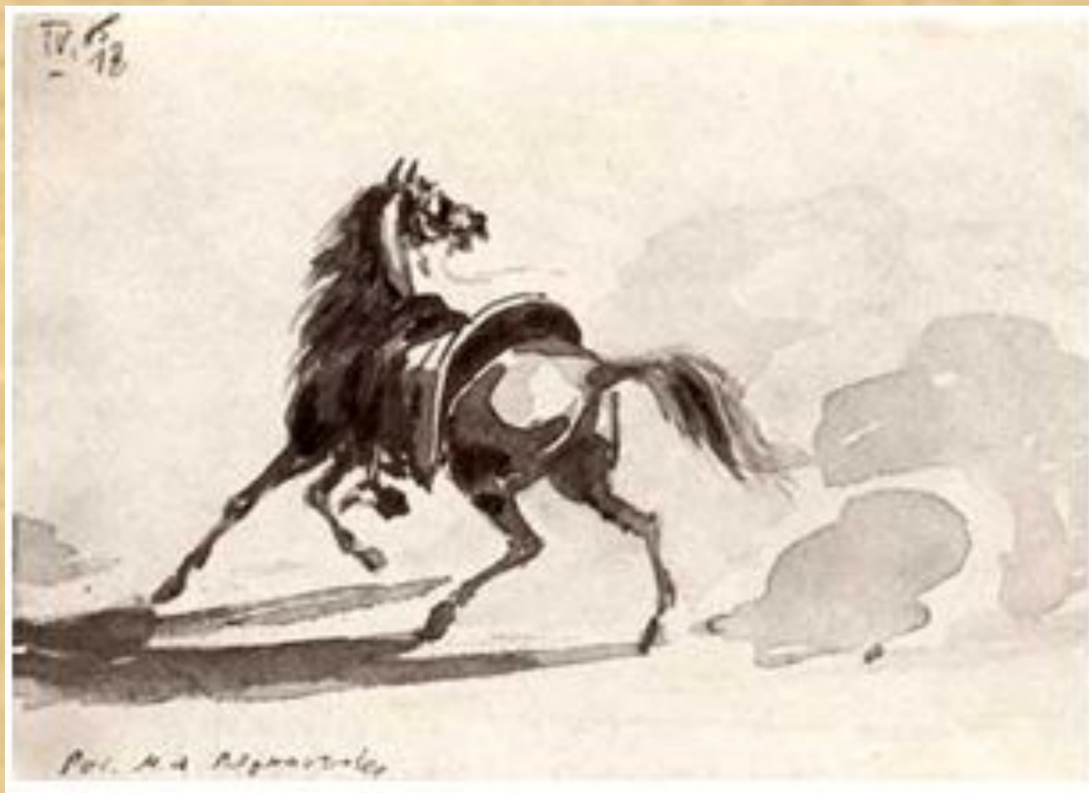
Оседланная лошадь. Сепия. 1830-е гг.