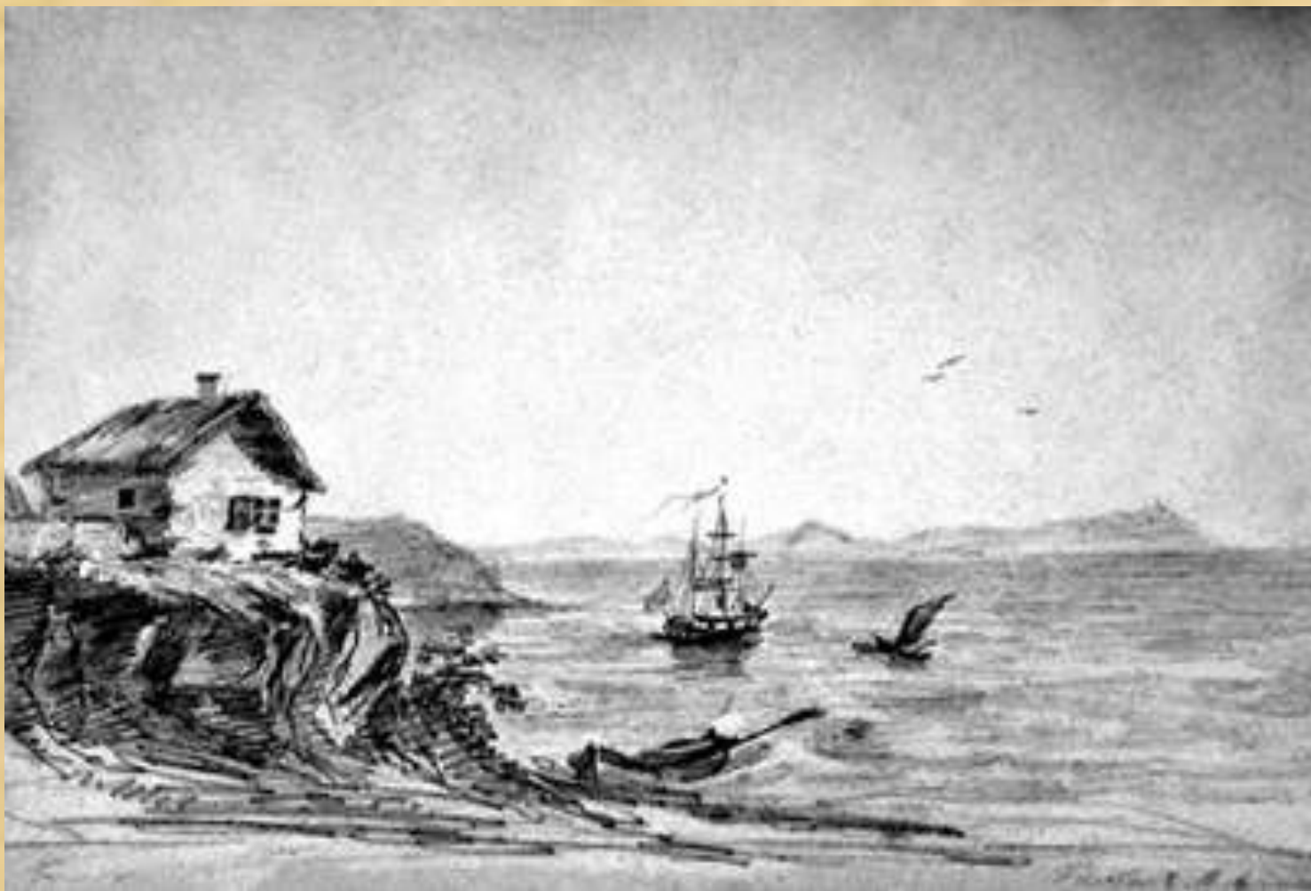
Тамань. Домик над морским обрывом. 1837 г.

Иллюстрации — самая небольшая группа рисунков.