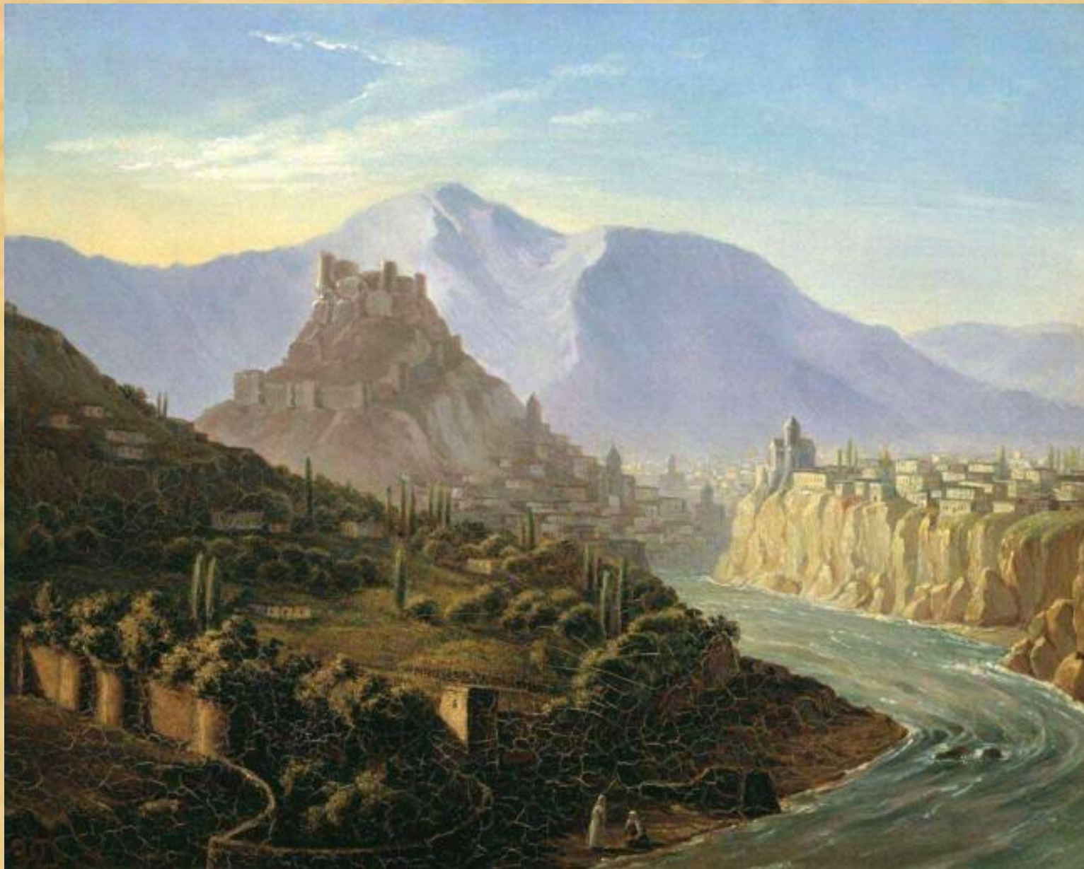
Вид Тифлиса Масло. 1837