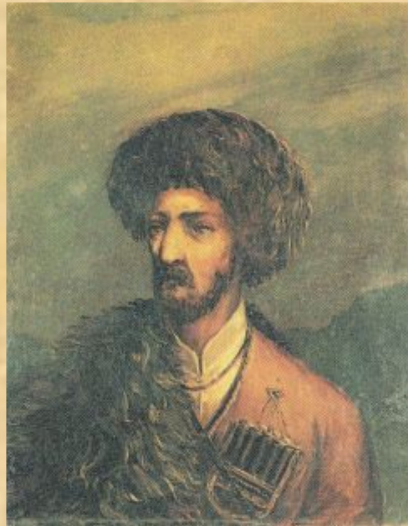
Черкес. Масло. 1838 г.