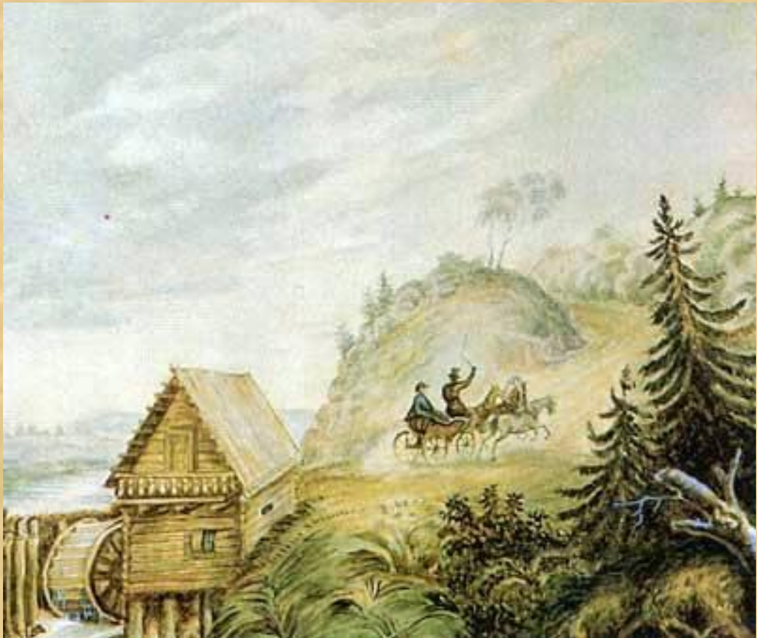
Пейзаж с мельницей и скачущей тройкой. Акварель 1835 г.