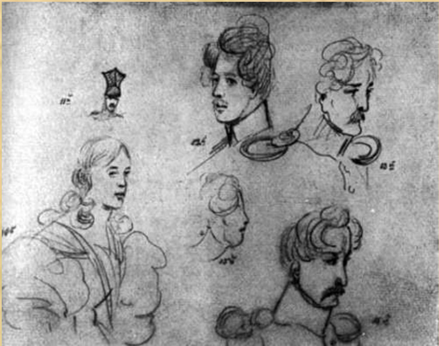
Лист набросков мужских и женских голов, среди которых портрет В. А. Лопухиной Рисунки карандашом Лермонтова, 1832—1834 гг.