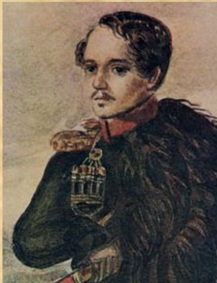
Автопортрет в бурке. Масло. 1837г.