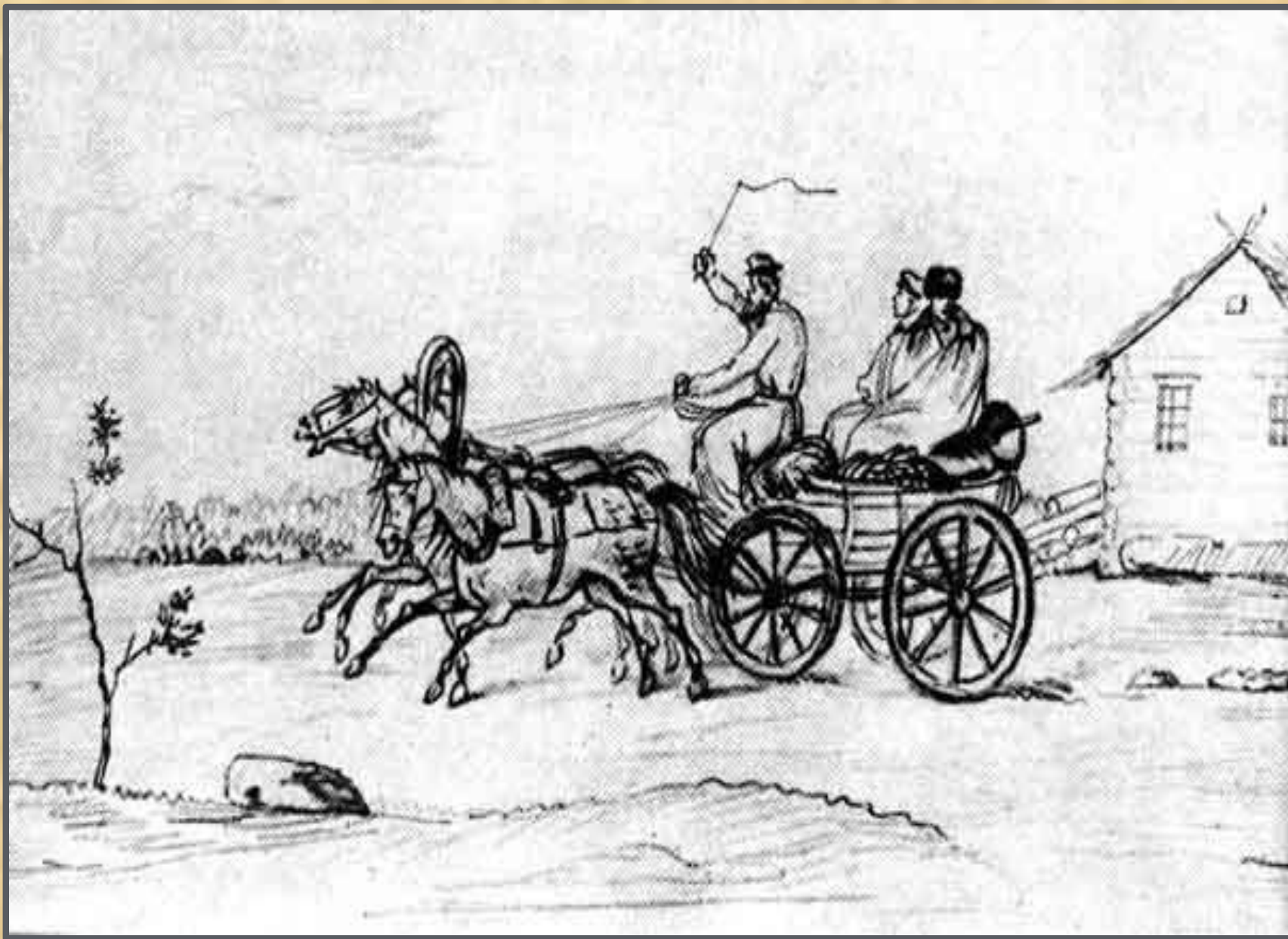
Тройка, выезжающая из деревни. Карандаш. 1832-1834 г.