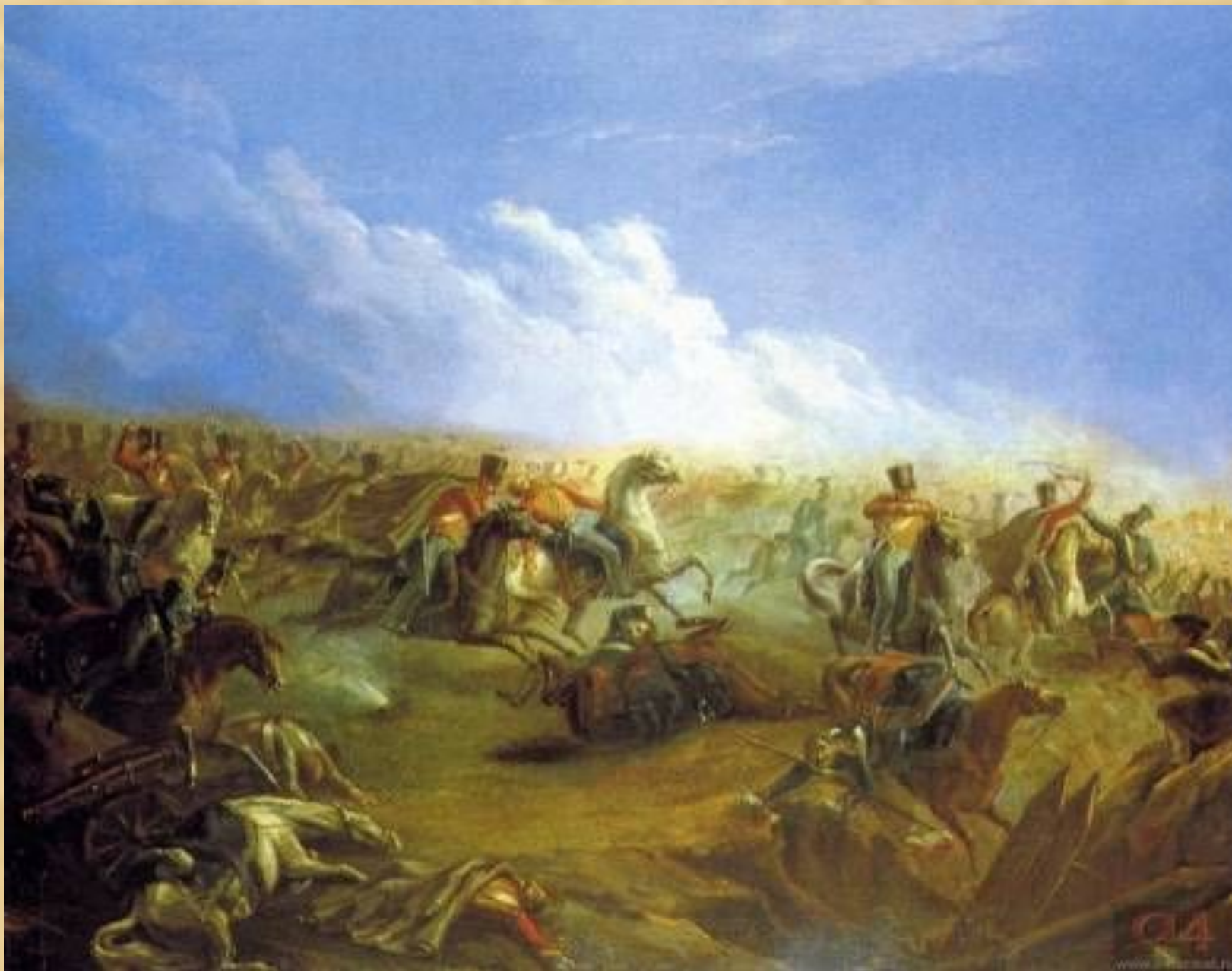
Атака гусар под Варшавой. Масло. 1837