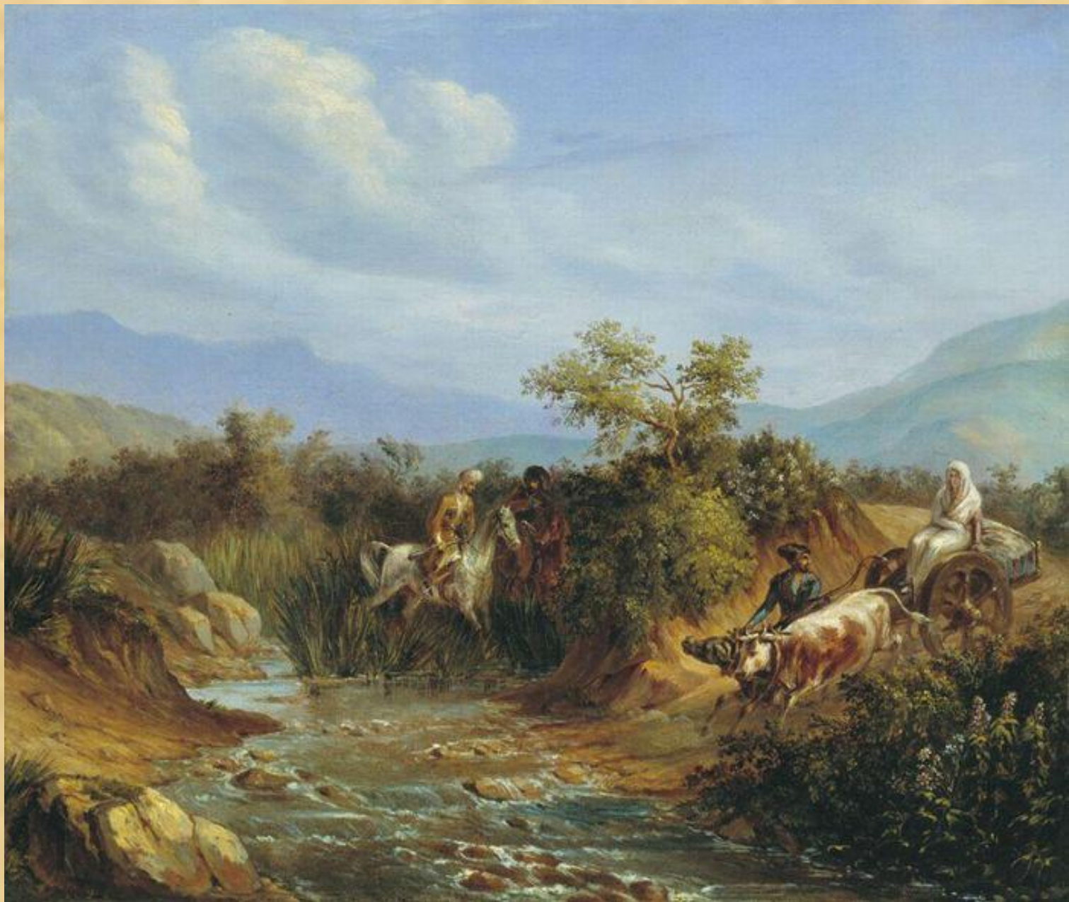
Сцена из кавказской жизни. Масло. 1838 г.