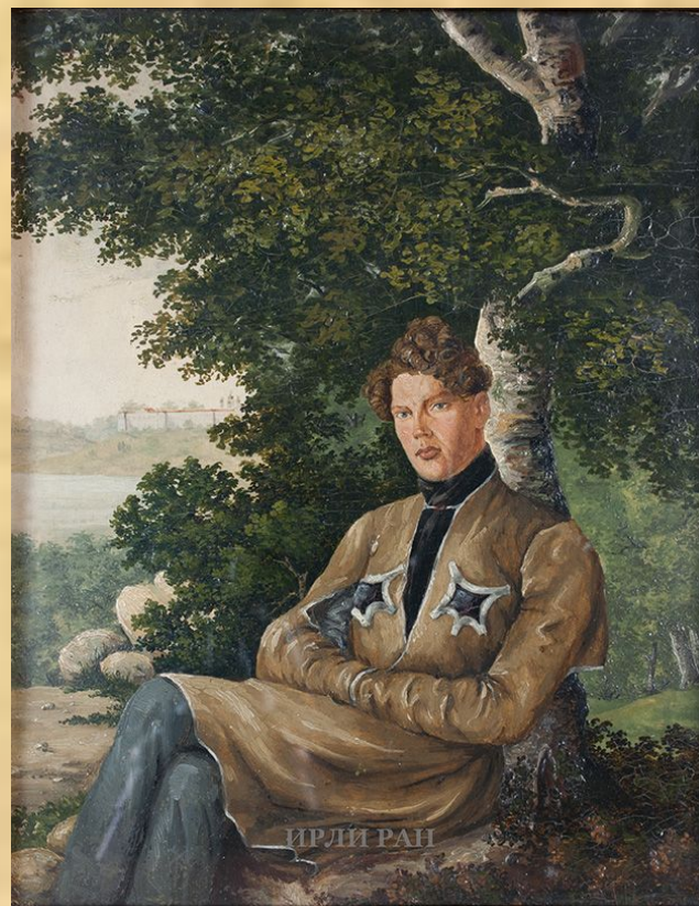
Портрет А. Н. Муравьева. Масло. 1836 — нач. 1838