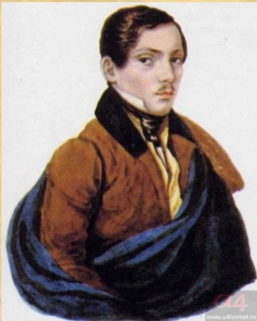
Неизвестный молодой человек в синем (С.А. Раевский?). Акварель