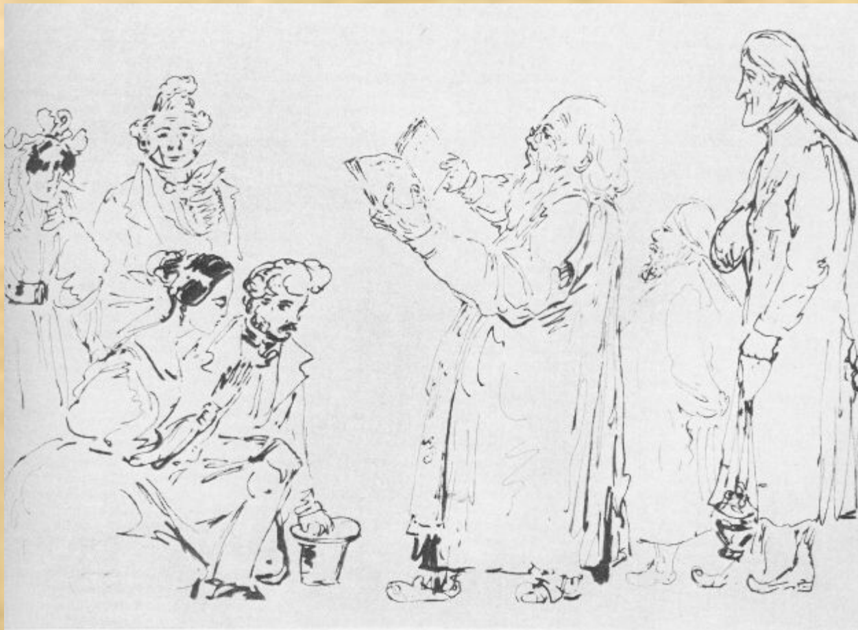
«Благословление молодых». Тушь, перо 1835