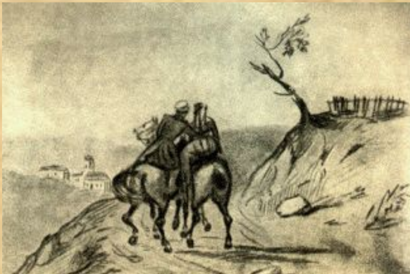
Автоиллюстрация к «Герою нашего времени» из альбома 1840-1841 годов (карандаш).