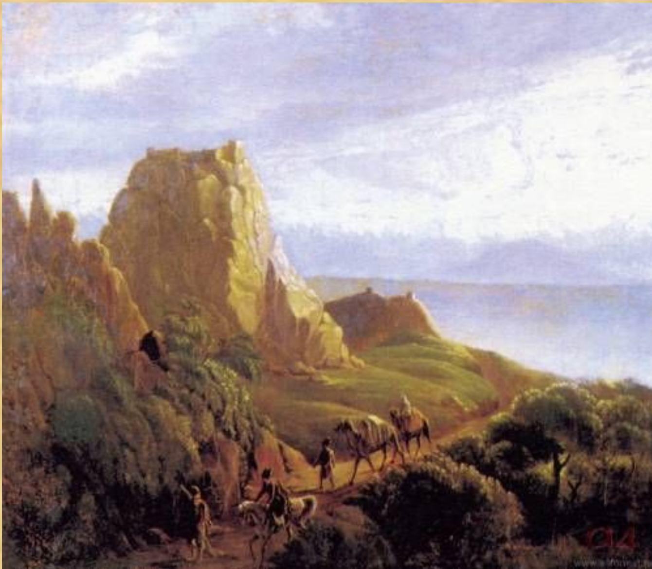
Кавказский вид с верблюдами Развалины скалы Тамарасцихе близ селения Карагач. Масло. 1837—38 г.