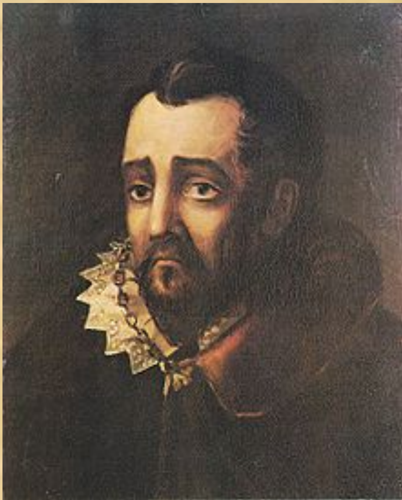
Герцог Лерма Масло. 1832-33