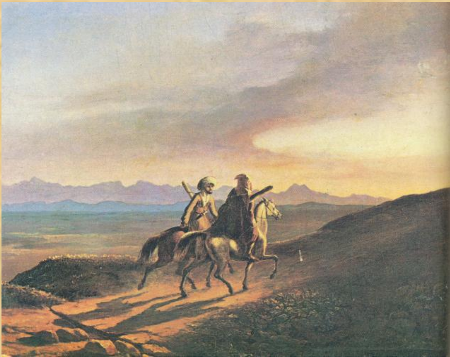
Воспоминания о Кавказе. Масло. 1838 г.