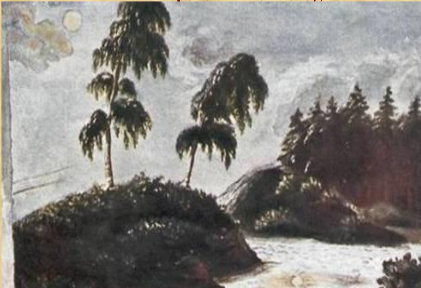
Пейзаж с двумя березами. Акварель. 1828—1832 г

Пейзажи (составляют большую часть картин Лермонтова и занимают значительное место среди его рисунков; среди акварелей их немного);