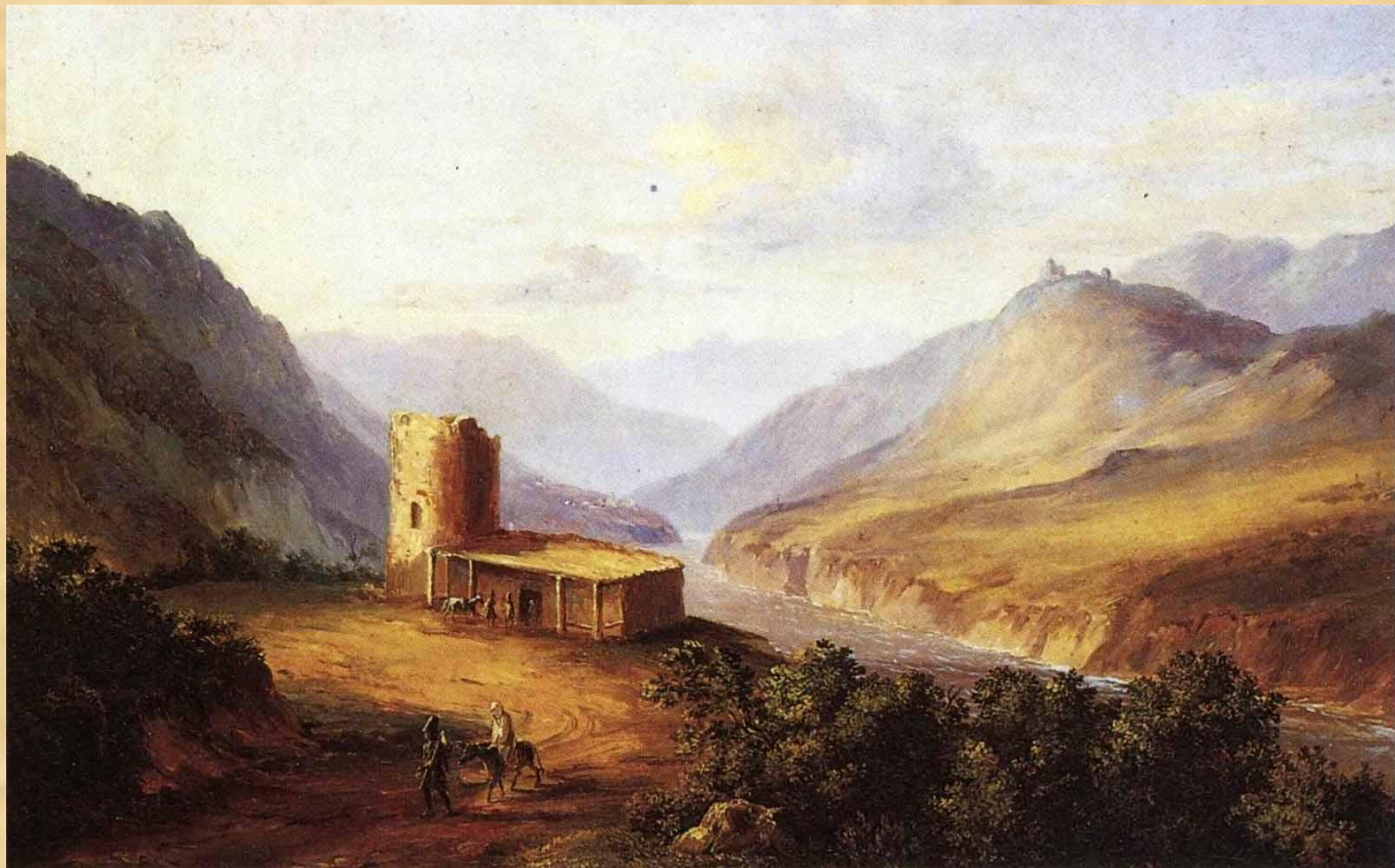
Кавказский вид сакли. Масло. Военно-Грузинская дорога близ Мцхета. 1837 г.