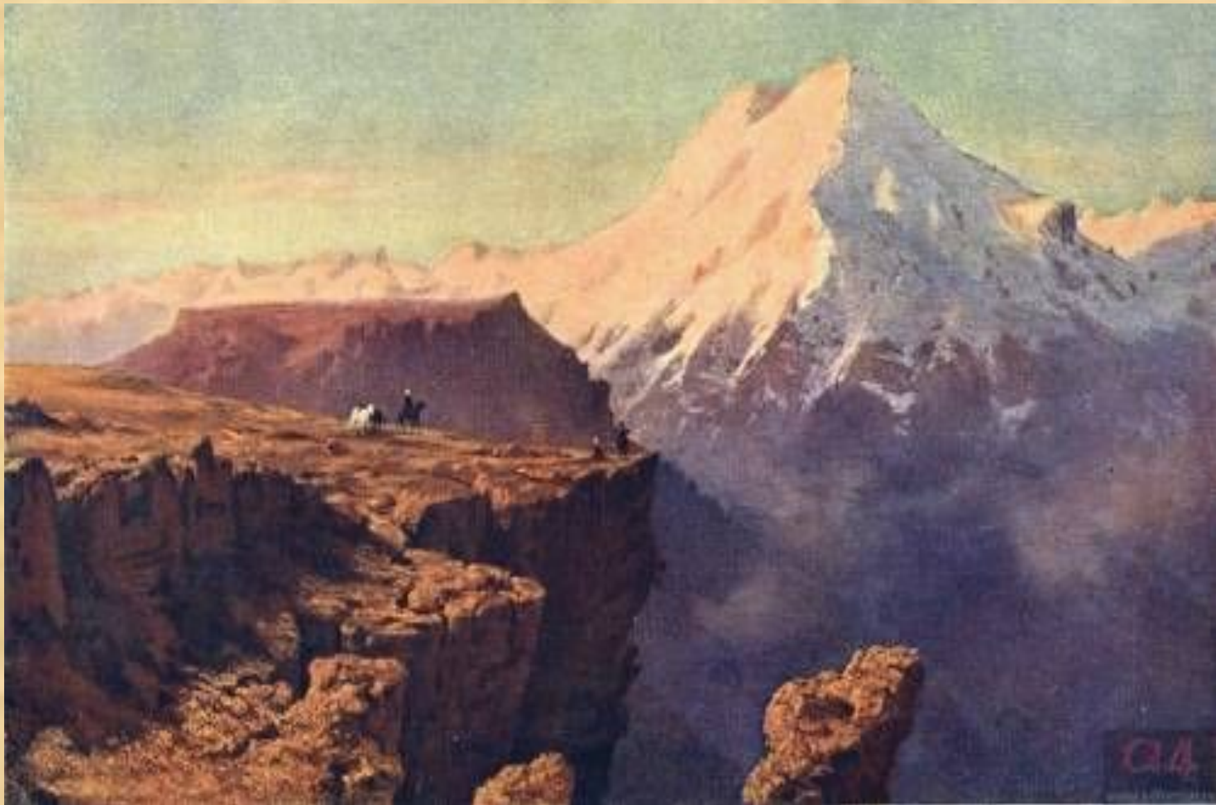
Кавказский вид с Эльбрусом. Масло. 1837