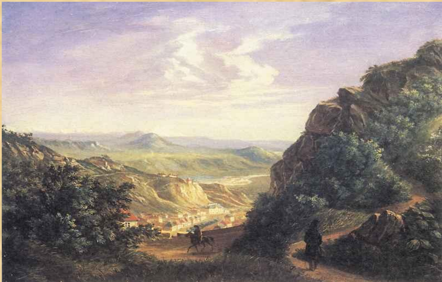
Вид Пятигорска. Акварель 1837 г.