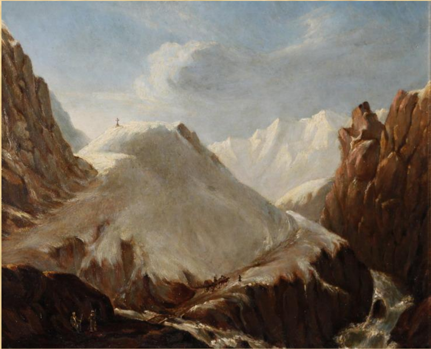
Крестовый перевал. Масло. 1837—38 г.