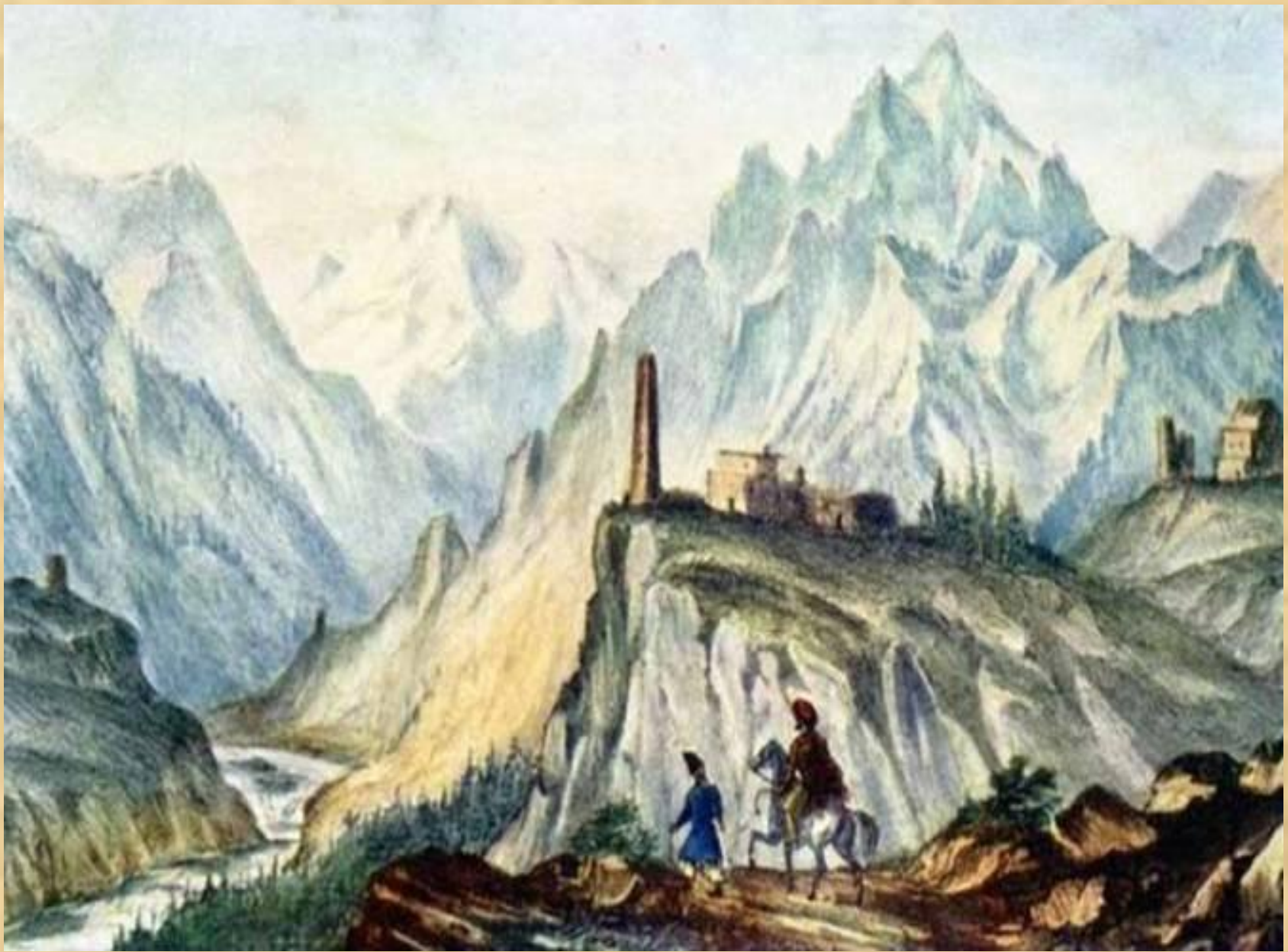
Вид Крестовой горы из ущелья близ Коби. Масло. 1837—38 г.