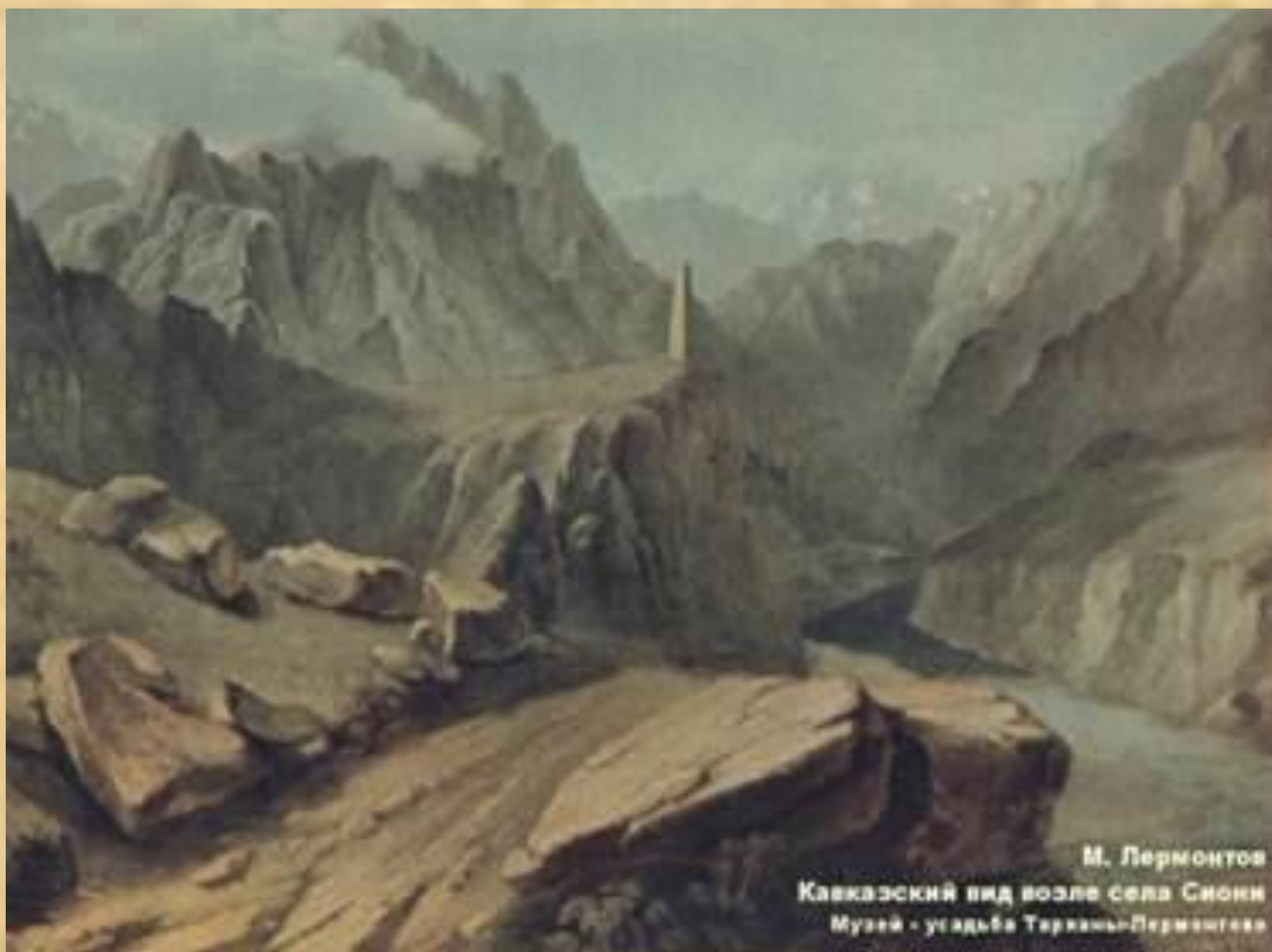
Кавказский вид близ селения Сиони. Масло. 1837 г.