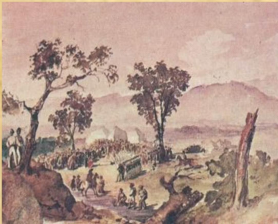
При Валерике. Похороны убитых. Акварель. 1840 г.

По своей тематике и жанровым признакам работы Лермонтова-художника могут быть разбиты на несколько групп: Военная тема (она преобладает среди акварелей и рисунков в альбомах и на отдельных листах)