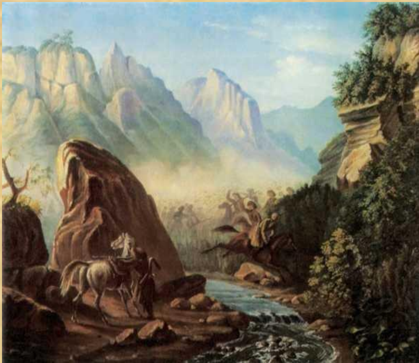
Перестрелка в горах Дагестана. Масло. (1840)