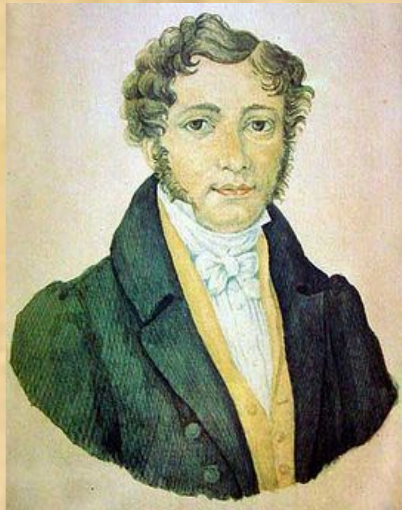
Отец Лермонтова Акварель. 1828 г.