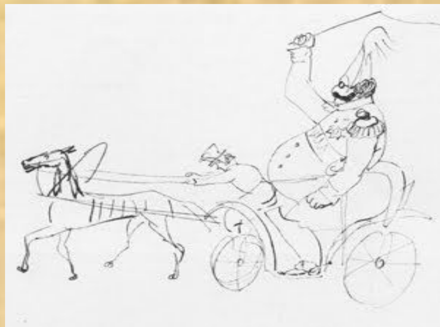
Карикатура. Поспешает на тревогу. Карандаш. 1841