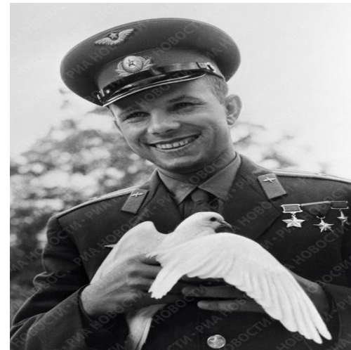
Ю. А. Гагарин