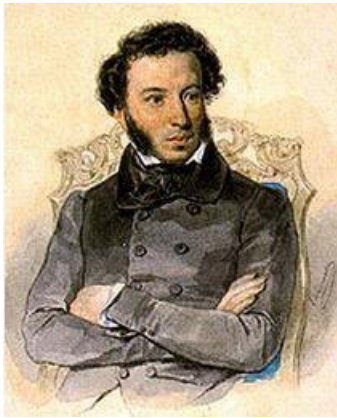
Пушкин А.С .