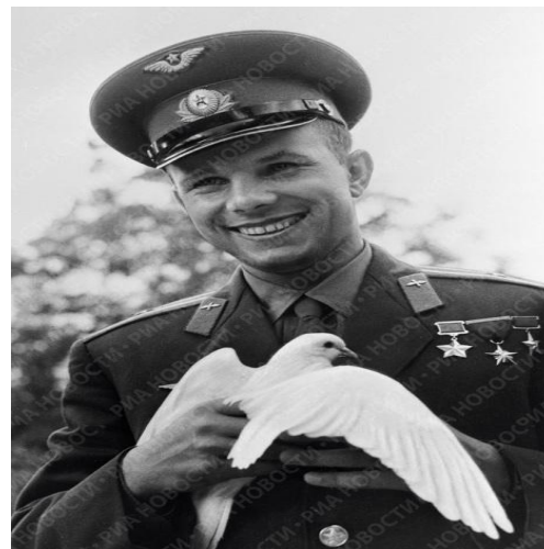
Ю. А. Гагарин