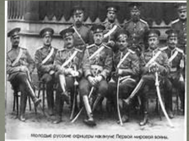
молодые русские офицеры накануне Первой мировой войны.

Вглядитесь в эти лица. Их уже давно нет среди нас... Однако мы должны помнить о подвиге, который совершили эти люди во имя спасения своей Родины.