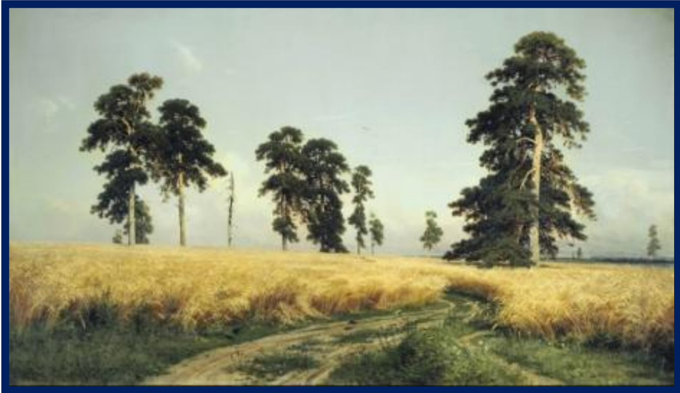
И. И. Шишкин «Рожь»

1) Старая дорога уходила в бесконечную русскую даль, заросшая кудрявой муравой.