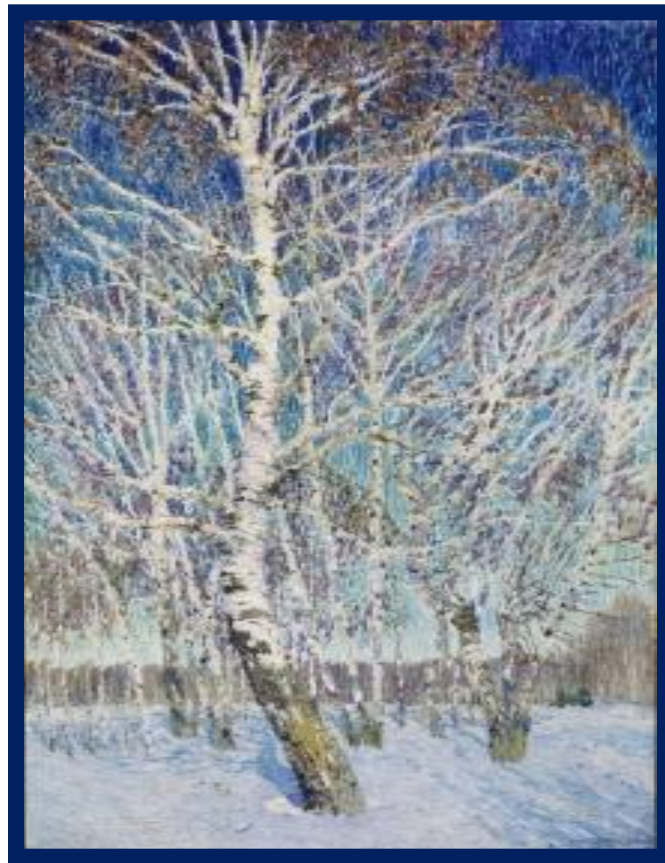
И. Э. Грабарь «Февральская лазурь»

б) Над глубокими свежими снегами, залившими чаши деревьев, синее, огромное и удивительно нежное небо.