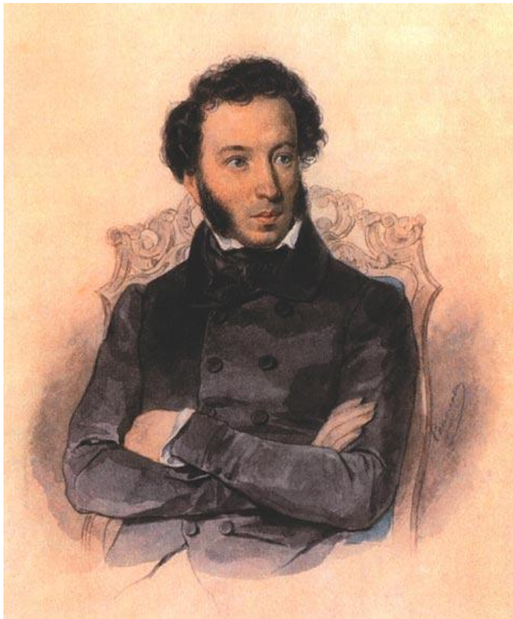
Александр Сергеевич Пушкин