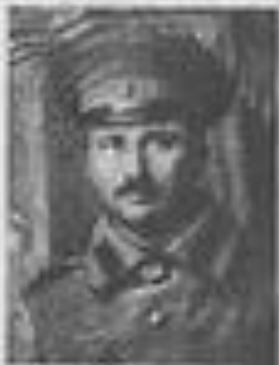
Василий Радников Семин [1888—1942]. Фот. 1913 г.