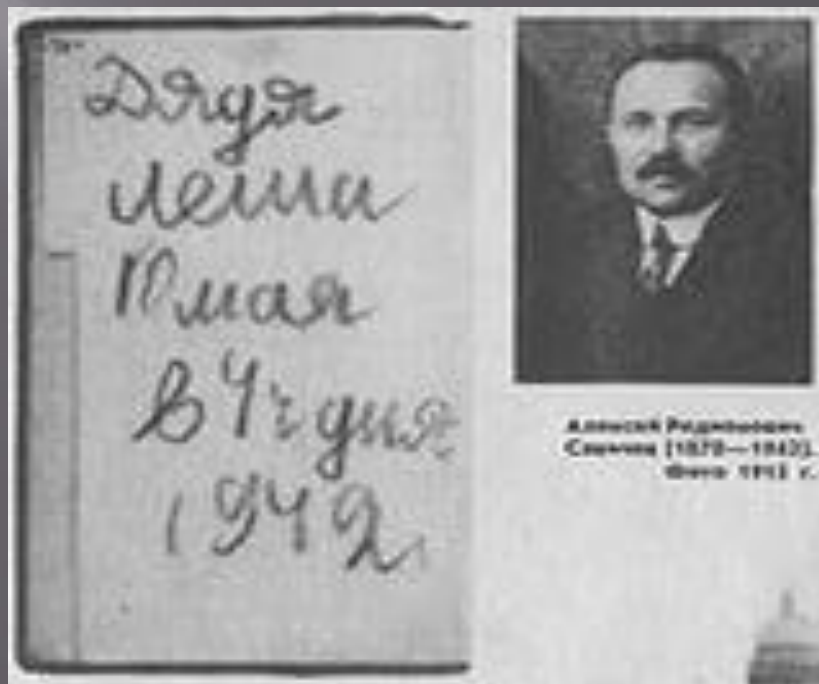
Алексей Радников Семин [1878—1942]. Фот. 1913 г.