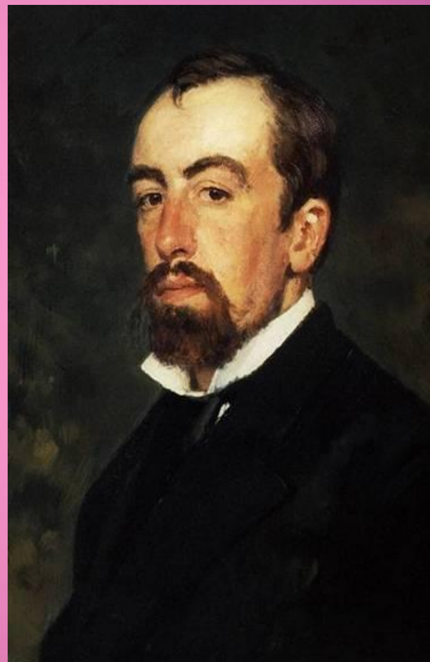
Портрет кисти Репина