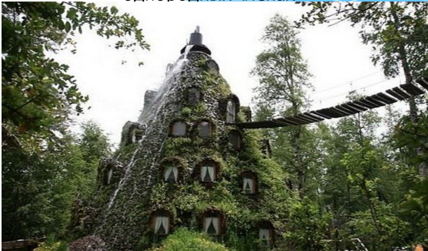
Север Патагонии Гостиница Magic Mountain.

Задание. На основе представленных иллюстраций составьте предложения, используя однородные члены предложения, а также с обобщающим словом при однородных членах