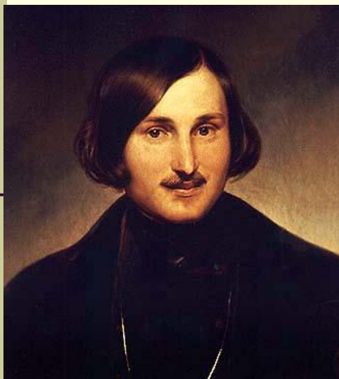
Н.В. ГОГОЛЬ 10 000 СЛОВ