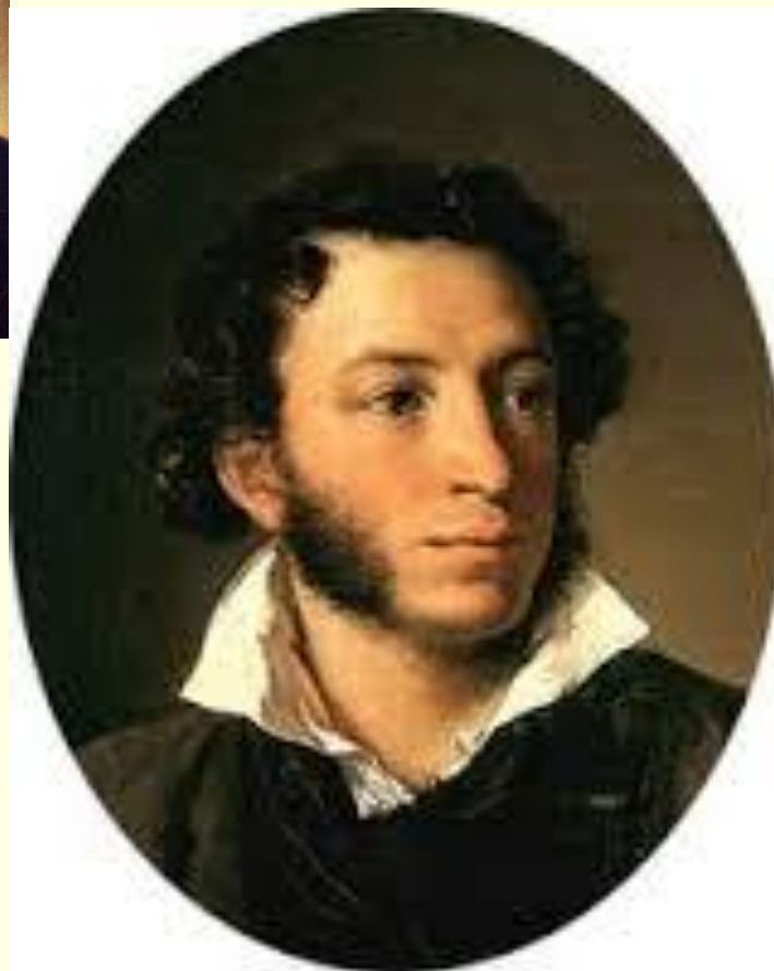
А.С.ПУШКИН 21191 СЛОВО