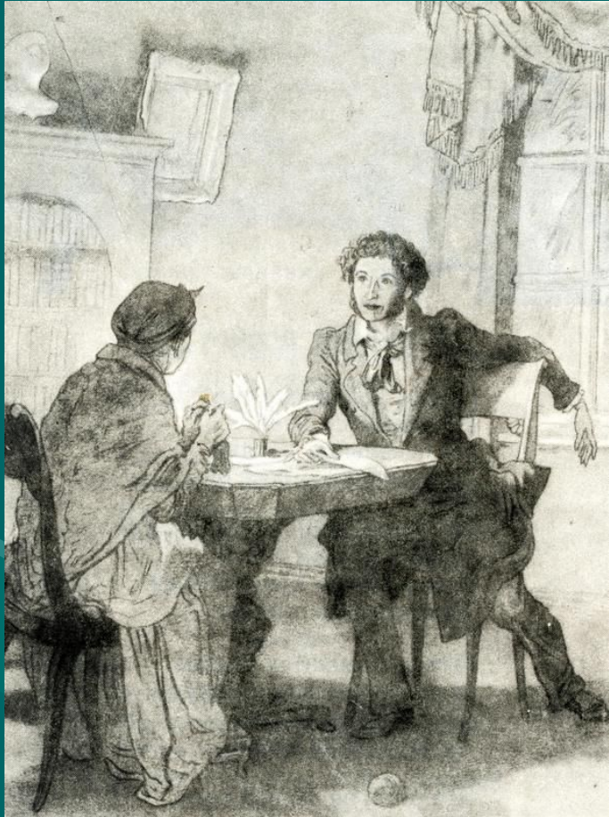
Иллюстрация к стихотворению «Зимний вечер»

Забота и любовь Арины Родионовны скрашивали поэту ссылку. Пушкин по-настоящему крепко любил свою няню и написал несколько трогательных стихотворений, к ней обращенных.