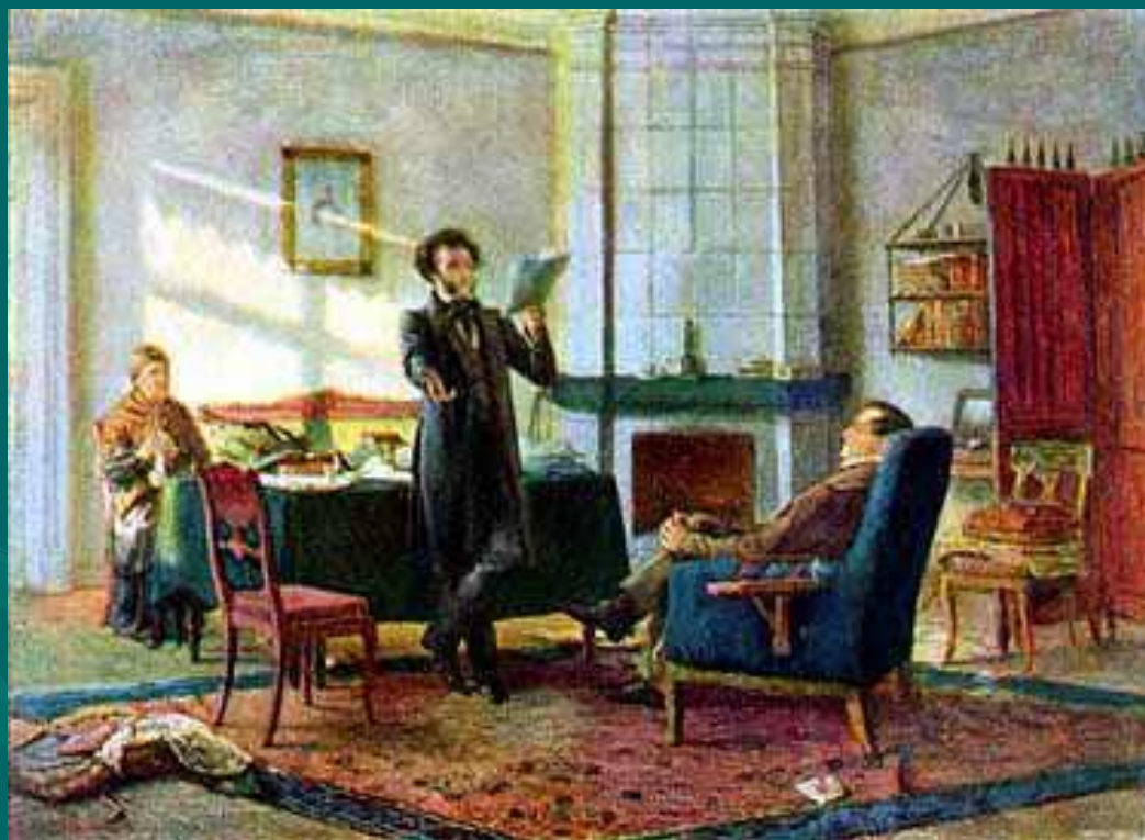
Пушкин в селе Михайловском (Пушкин у Пушкина). Н.Н. Ге. 1875 г.

За три года ссылки написаны "Кавказский пленник", "Бахчисарайский фонтан", а также "Узник", "Песнь о вещем Олеге». Начат роман в стихах "Евгений Онегин".