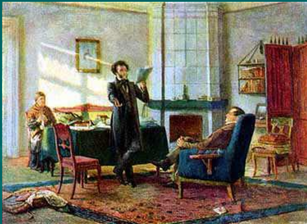
Пушкин в селе Михайловском (Пушкин у Пушкина). Н.Н. Ге. 1875 г.

За три года ссылки написаны "Кавказский пленник", "Бахчисарайский фонтан", а также "Узник", "Песнь о вещем Олеге». Начат роман в стихах "Евгений Онегин".