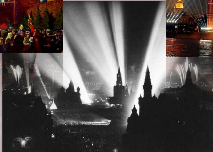
9 мая 1945 года в Москве