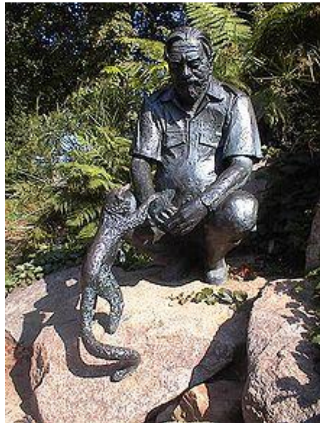
Скульптура в зоопарке Джерси