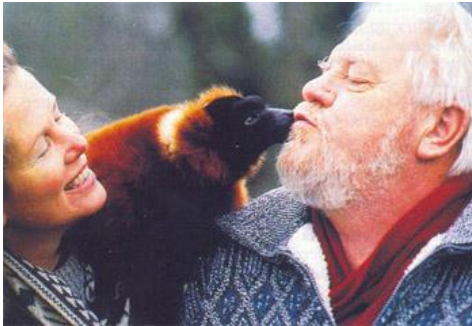
Джеральд Даррелл. Фото 1994