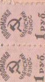
Профсоюзный билет Юрченко Р.В.