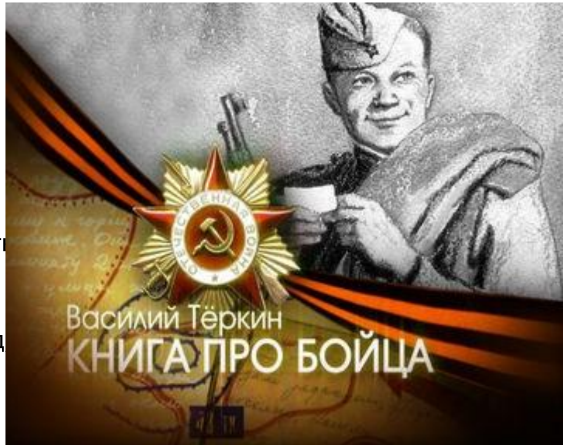
«Василий Теркин» А.Твардовский

Грянул год, пришел черед Нынче мы в ответе За Россию, за народ И за все на свете.