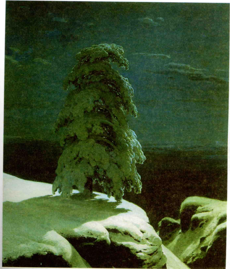
«На севере диком...». Художник И. Шишкин