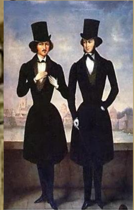
Неизвестный художник первой половины XIX века. Пушкин и Гоголь

7 октября 1835 г. Гоголь просит Пушкина дать ему «сюжет, хоть какой-либо смешной, или не смешной, но русский чисто анекдот» и обещает: Будет комедия из 5 актов, и клянусь , будет смешнее