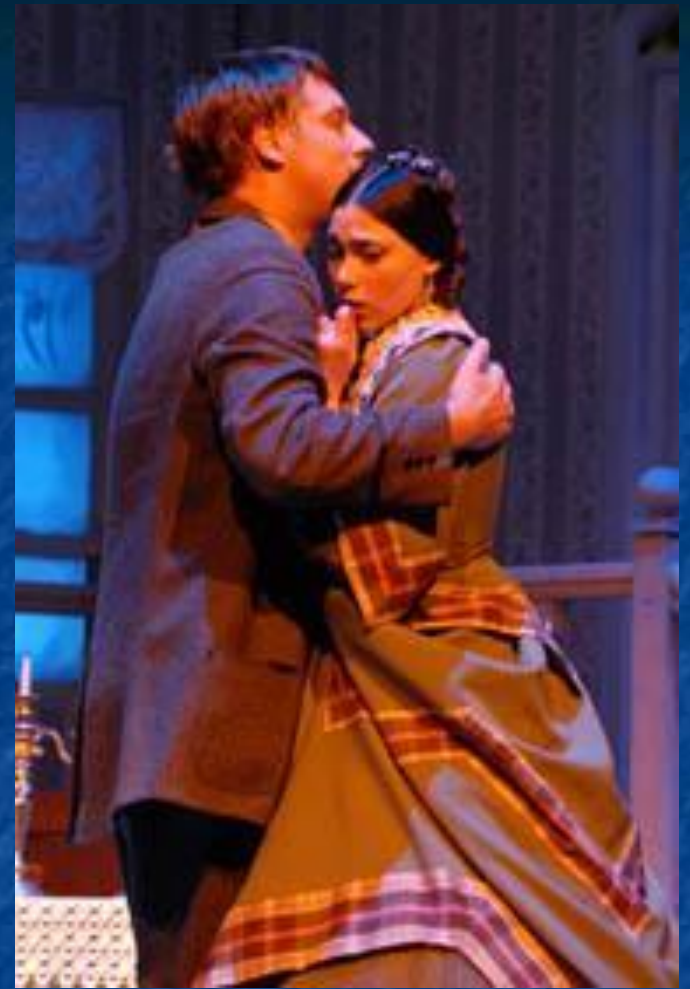
Сцена из пьесы А.Н. Островского «Бедность не порок».