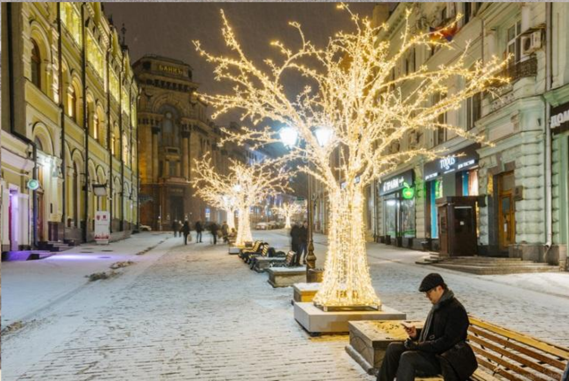
О. КАДОЛЬ Кузнецкий мост. 1834 год