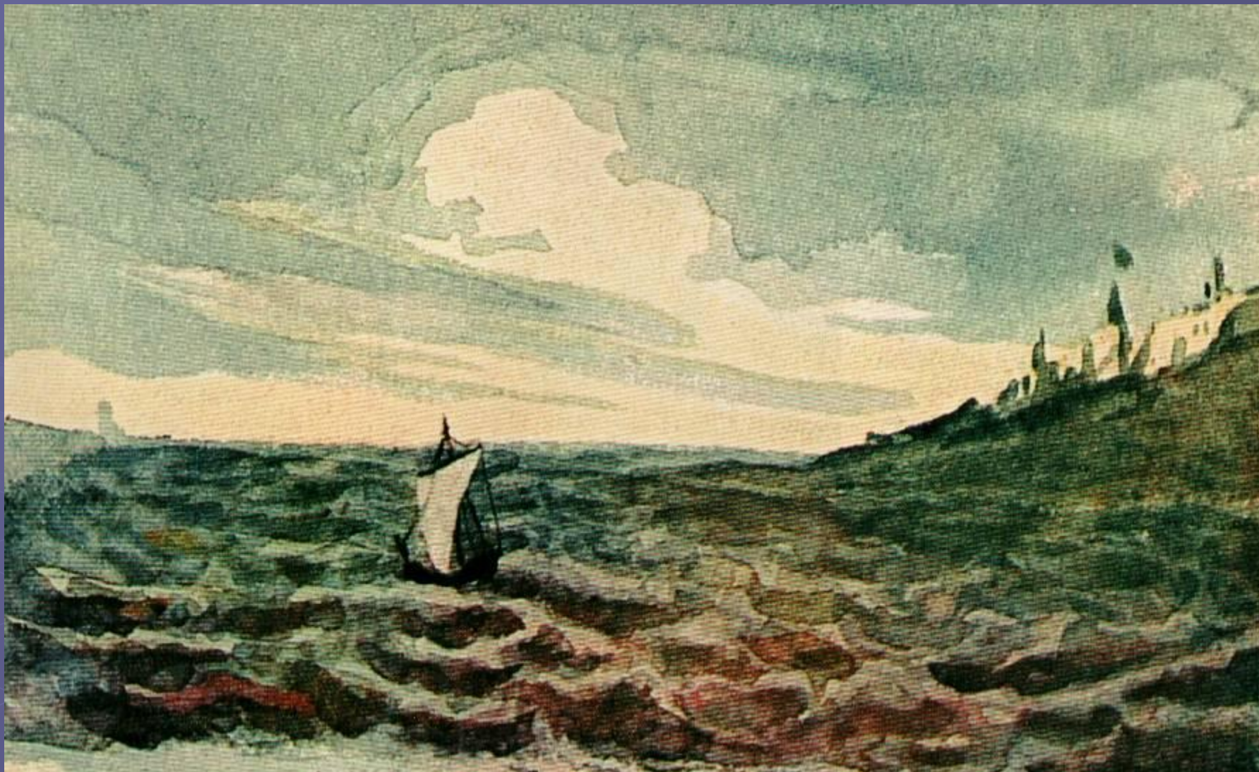
«Парус». Акварель Лермонтова.