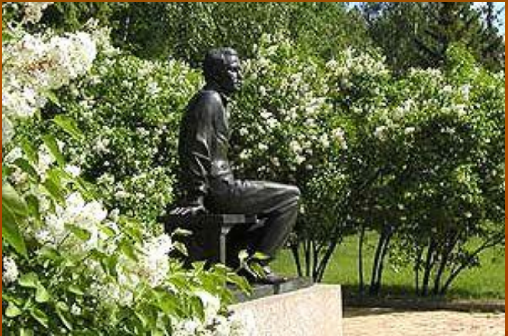
Памятник М.Ю.Лермонтову в Тарханах.