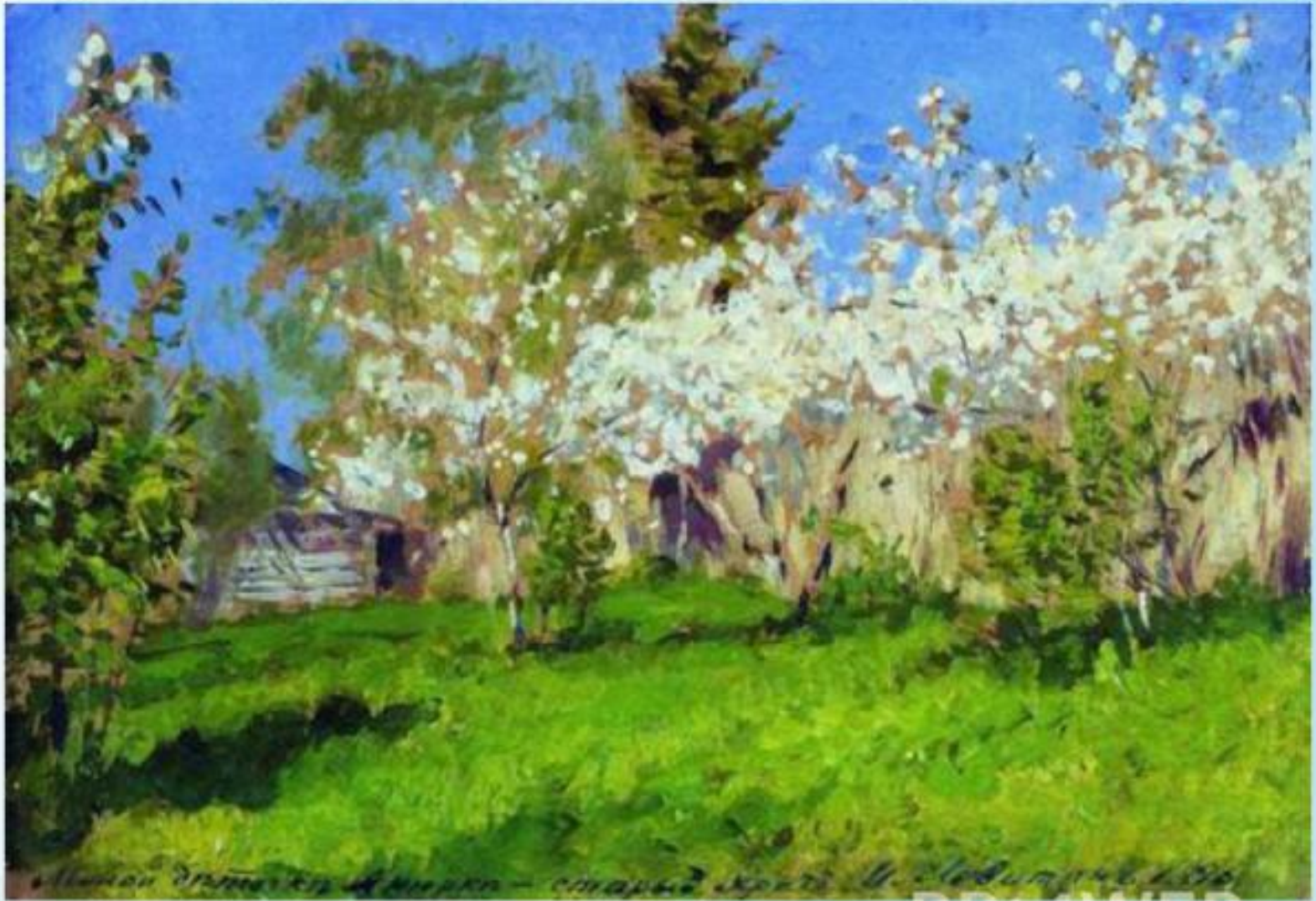
И. Левитан «Цветущие яблони»