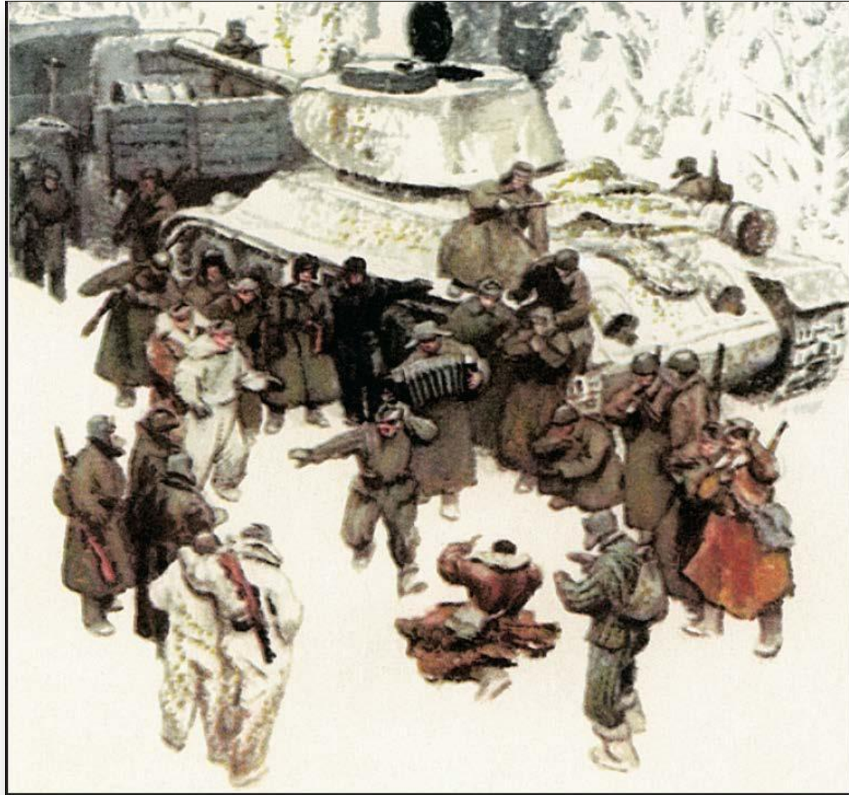
Иллюстрация к поэме А.Т. Твардовского «Василий Тёркин». Художник О.Г. Верейский. 1943 г.

Одна из последних глав называется «По дороге на Берлин» .