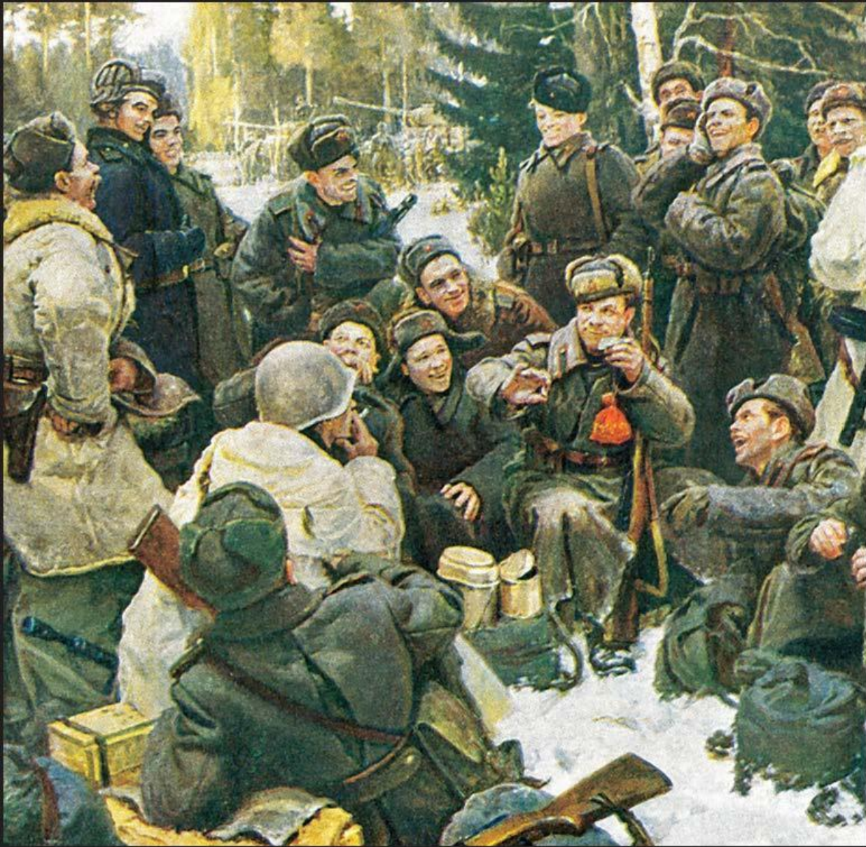
«Отдых после боя». Художник Ю.М. Непринцев. 1951 г.

Три части поэмы соответствуют трём этапам положения на фронтах: начальное отступление, переломный этап после победы под Сталинградом, победное наступление 1944 – 1945 г.г. И полный разгром врага на его территории.