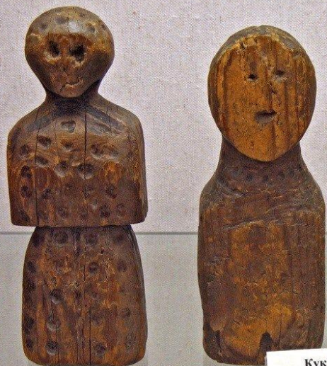
Куклы-панки. Конец XIX в. Онежский уезд, Архангельская губ. Дерево Panka Dolls. Late 19th century Onega district, Arkhangelsk Province Wood

Народная кукла – это не просто обычная детская игрушка, ее корни уходят в глубокую древность.