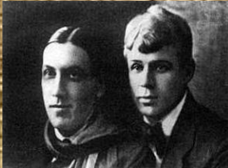
Есенин, Мариенгоф 1919

«Среди прославленных и юных ты был всех лучше для меня...»