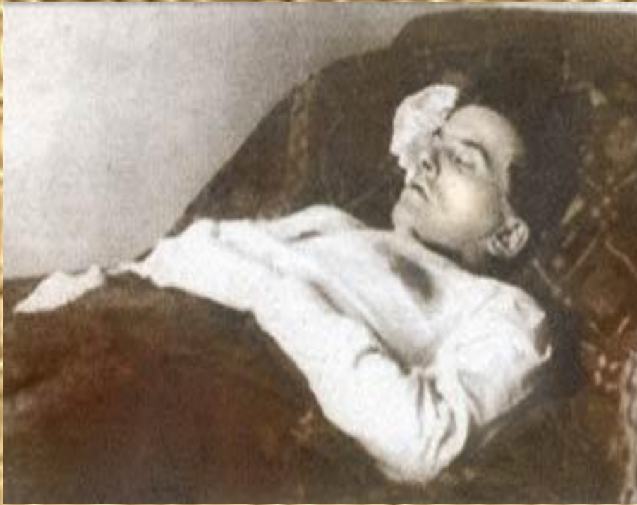
Последняя фотография Маяковского