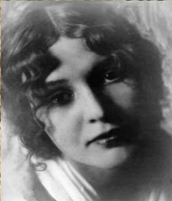
• Зинаида Райх