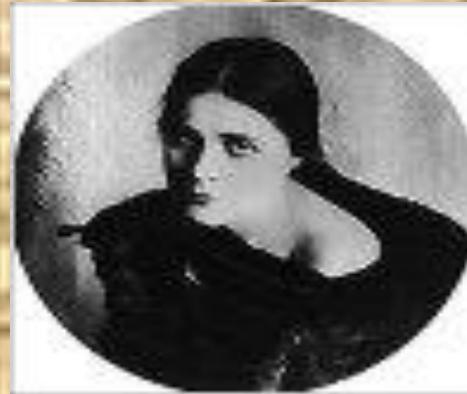
Лиля Юрьевна Брик