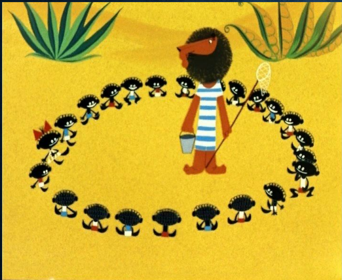
«Каникулы Бонифация» мультфильм 1965г