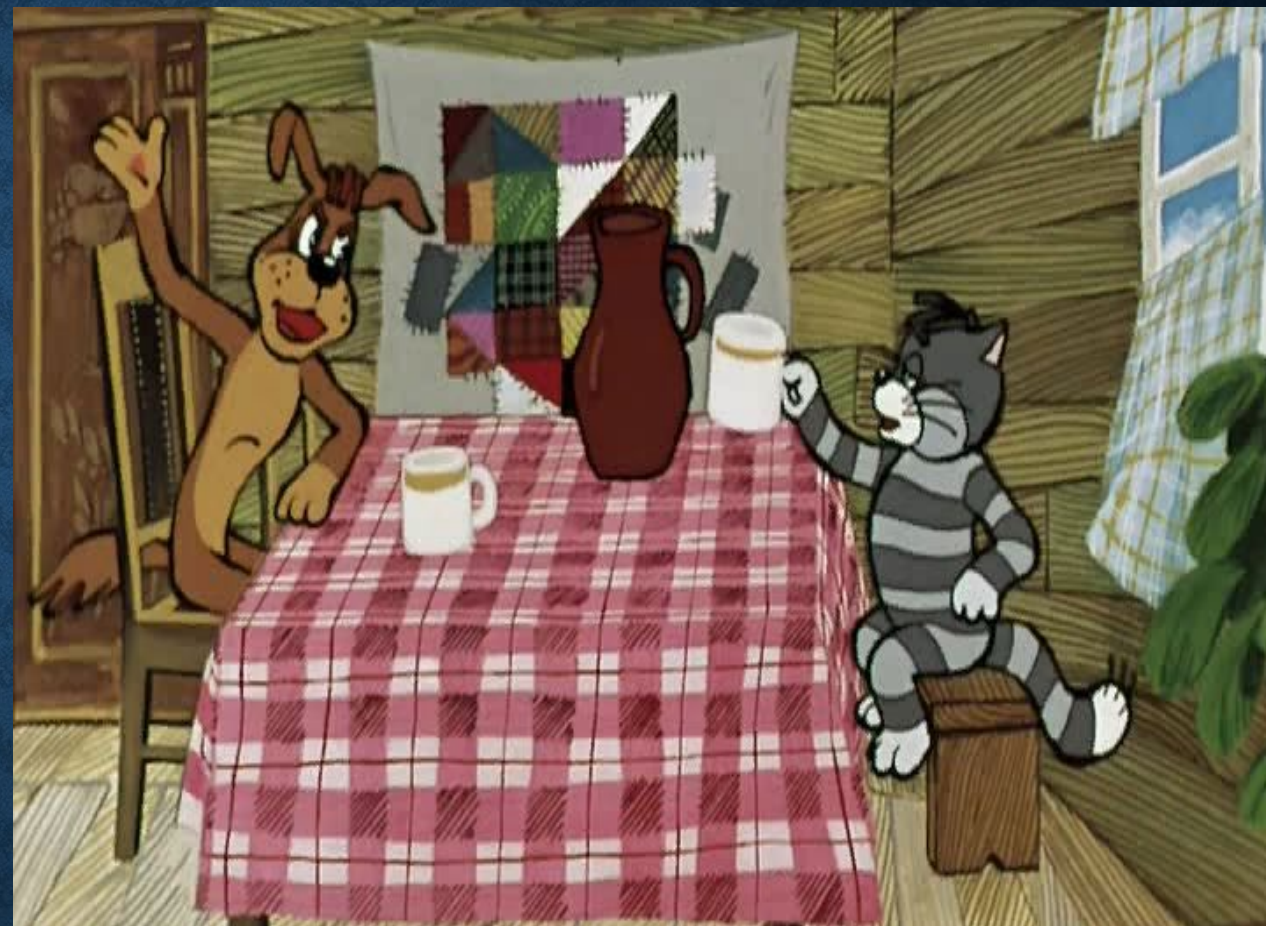
«Каникулы в Простоквашино» мультфильм 1980г