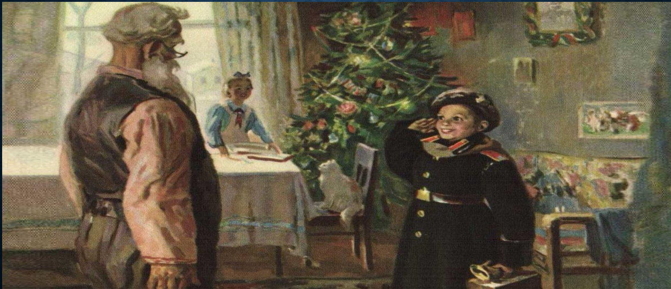
«Прибыл на каникулы» Федор Решетников