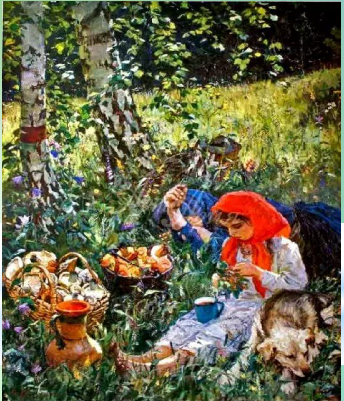
«Летом». 1954 г.