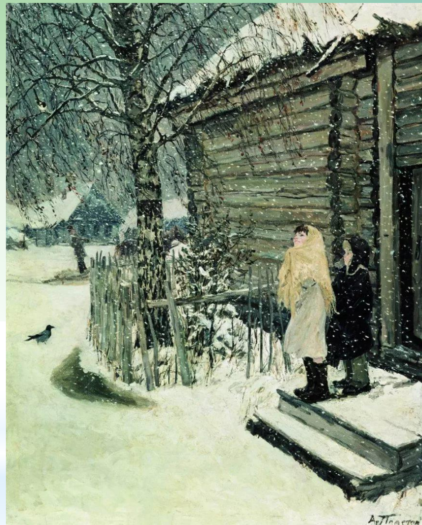
«Первый снег». 1946 г.