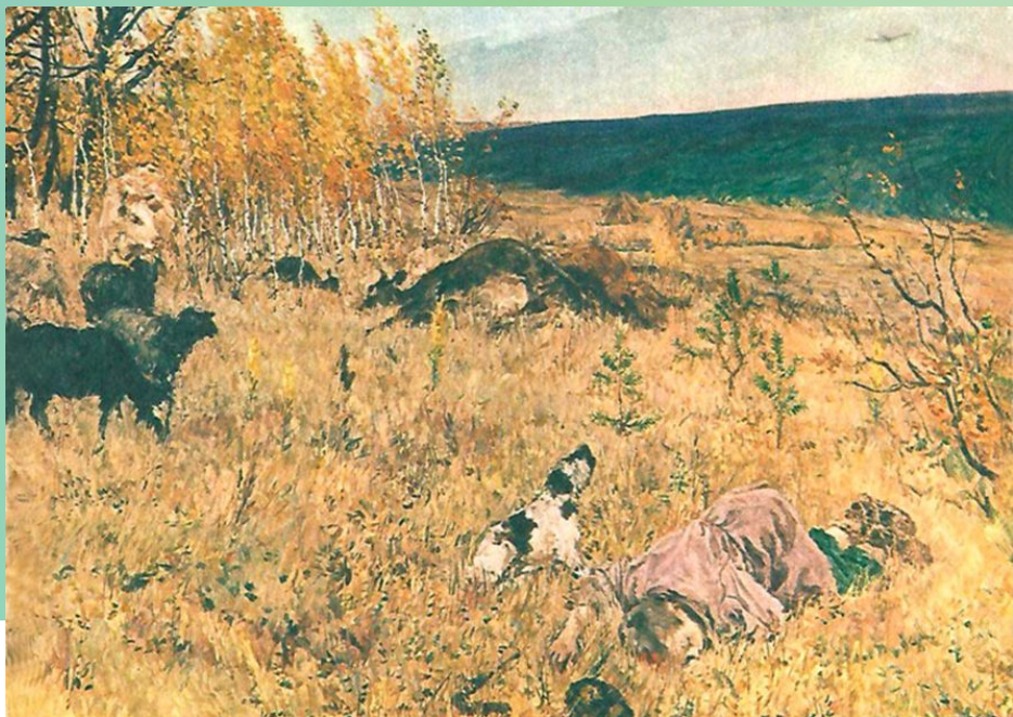
«Фашист пролетел». 1942 г.