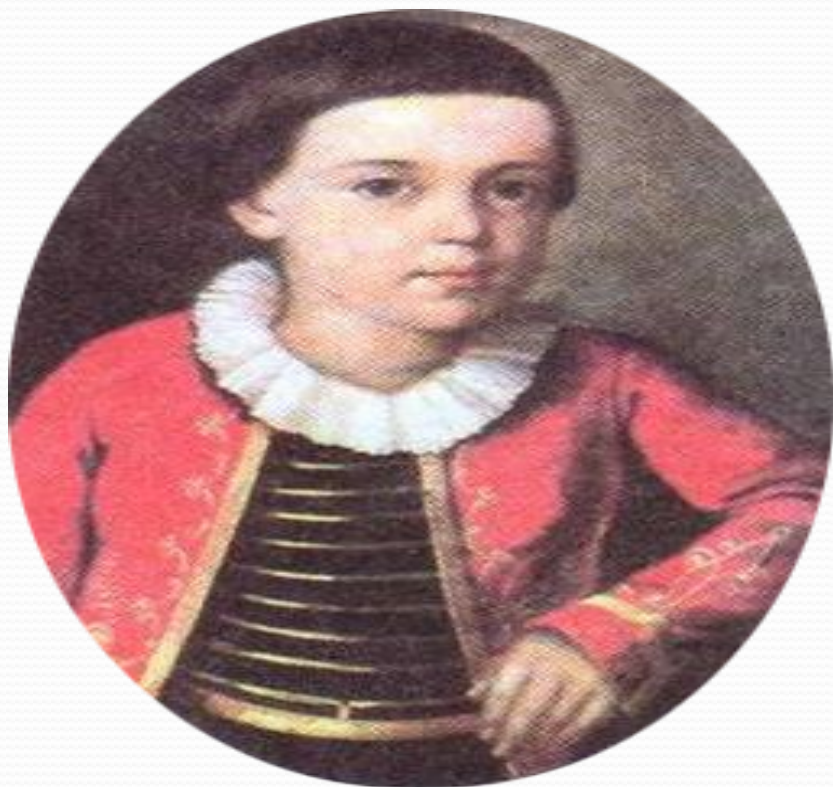
М.Ю.Лермонтов ребёнком. Портрет работы неизвестного художника. Масло. 1820-1822гг