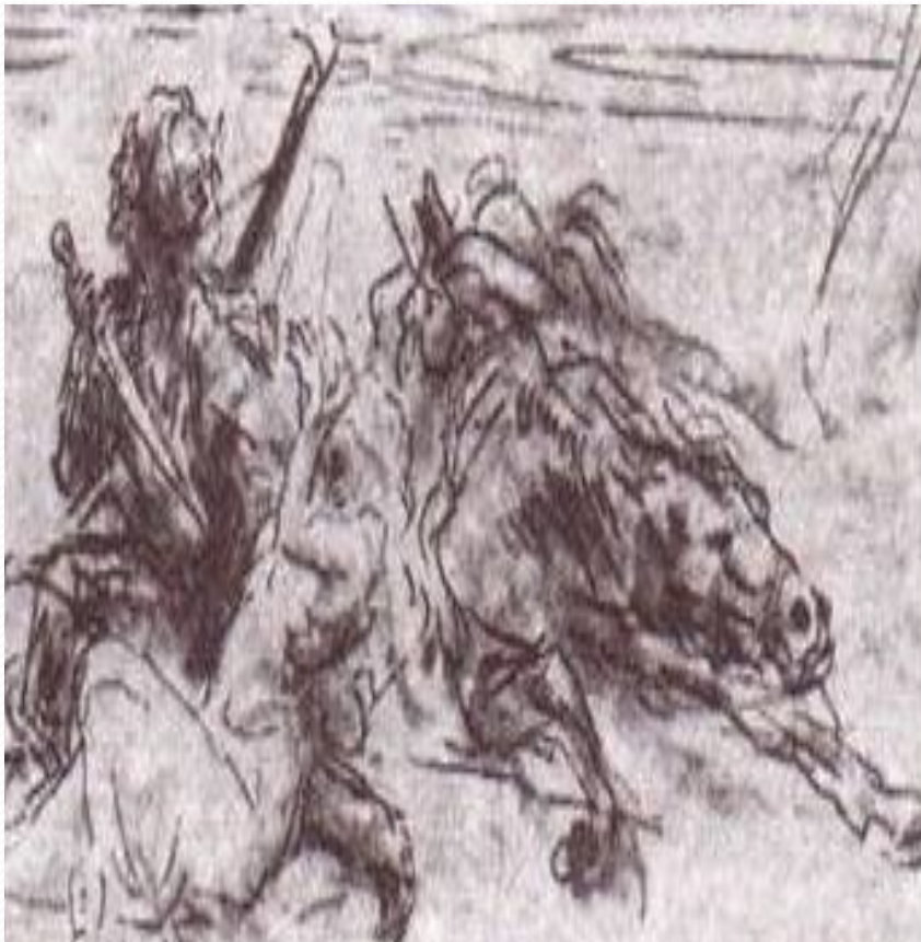
«Бэла». Ил. И.Е. Репина. 1887