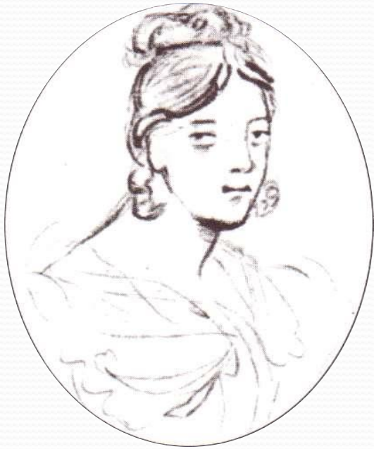
Портрет молодой женщины. (В.А. Лопухина ) 1832-1834