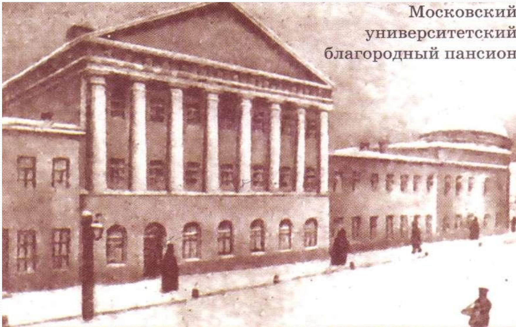
Московский университетский благородный пансион