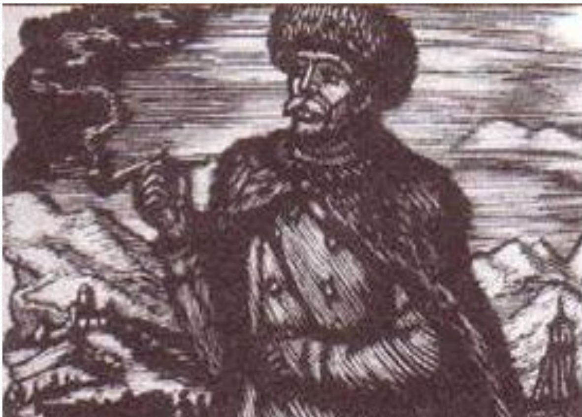
«Максим Максимыч». Ил. Ф.Д. Константинова. 1961