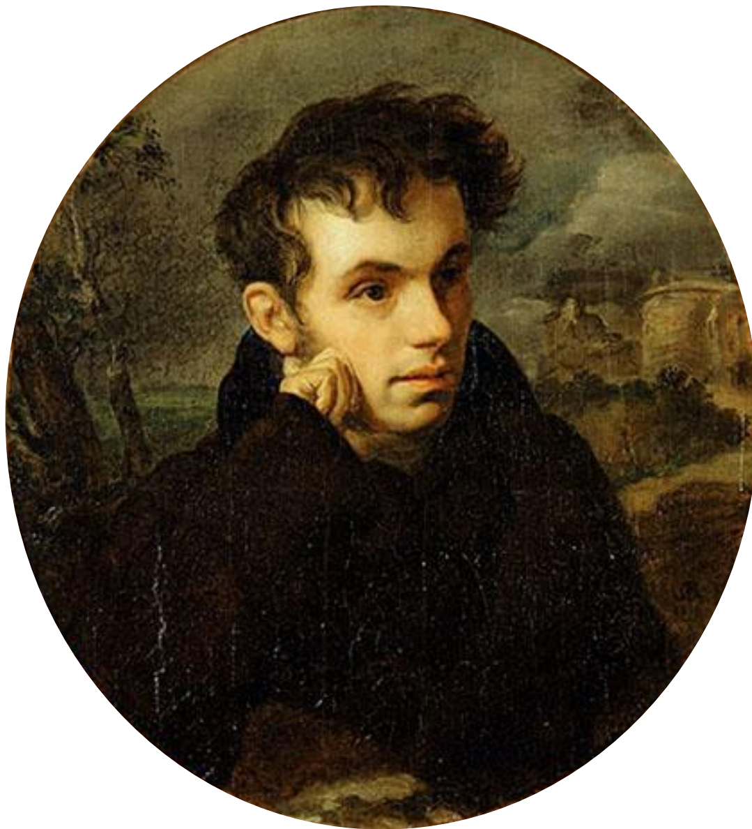
Василий Андреевич Жуковский (1783-1852)