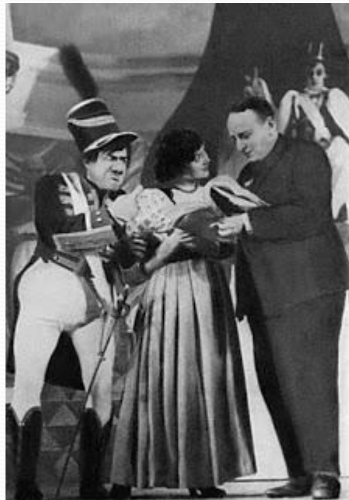
Е. Л. Шварц на репетиции спектакля «Тень» в Ленинградском театре комедии

Помимо работы на театральных подмостках, Шварц писал фельетоны и являлся литературным секретарем Корнея Чуковского, пробовал себя в роли журналиста в городе Донецк.