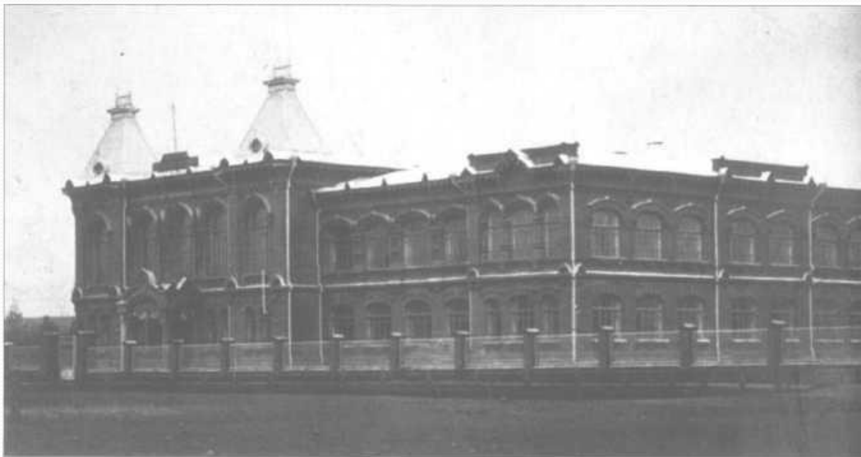
Майкоп. Реальное училище.