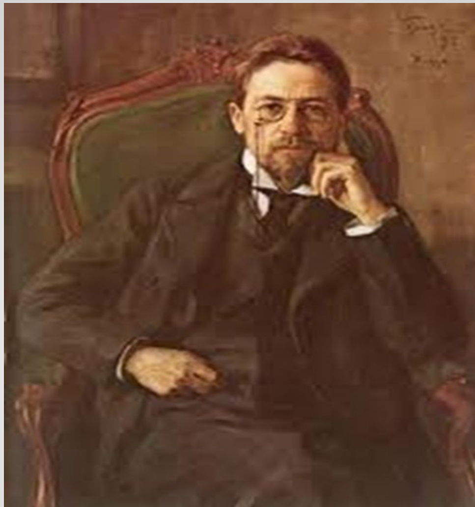
АНТОН ПАВЛОВИЧ ЧЕХОВ (1860-1904)