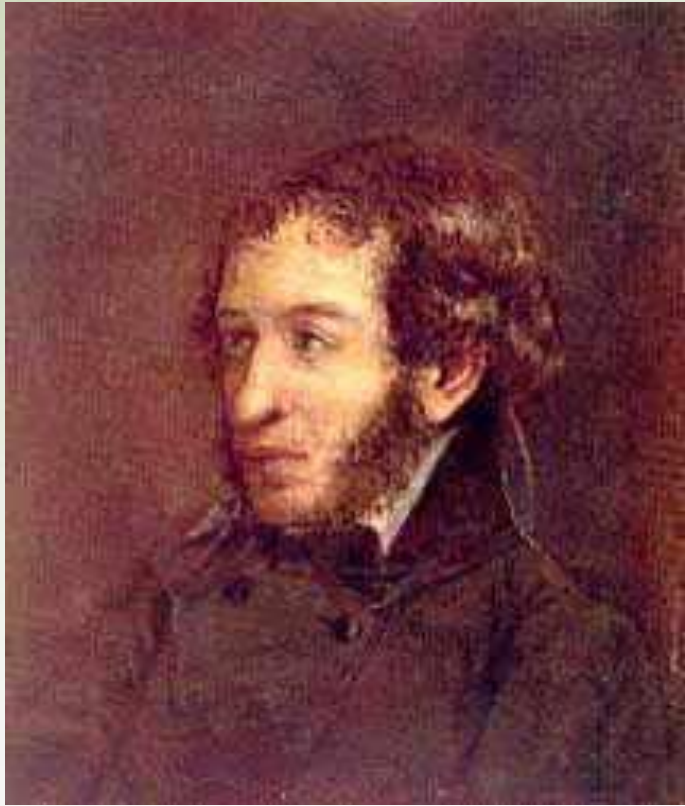
Портрет А.С.Пушкина. Художник Иван Логинович Линев, 1836г.

Пушкин в письме к Пущину: «Я только завидую тем из них у коих супруги не красавицы, не ангелы прелести, немадонны...Знаешь русскую песню – « Не дай бог хорошей жены. Хорошу жену часто в пир зовут. А бедному – то мужу во чужом пиру похмелье, да и в своем тошнит».