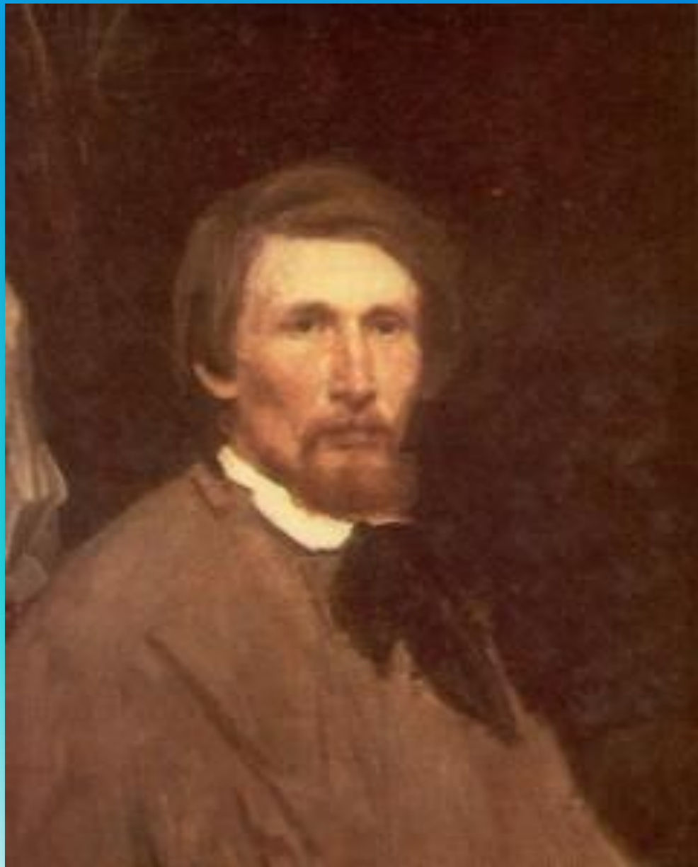
Виктор Михайлович Васнецов (1848-1926 г.)