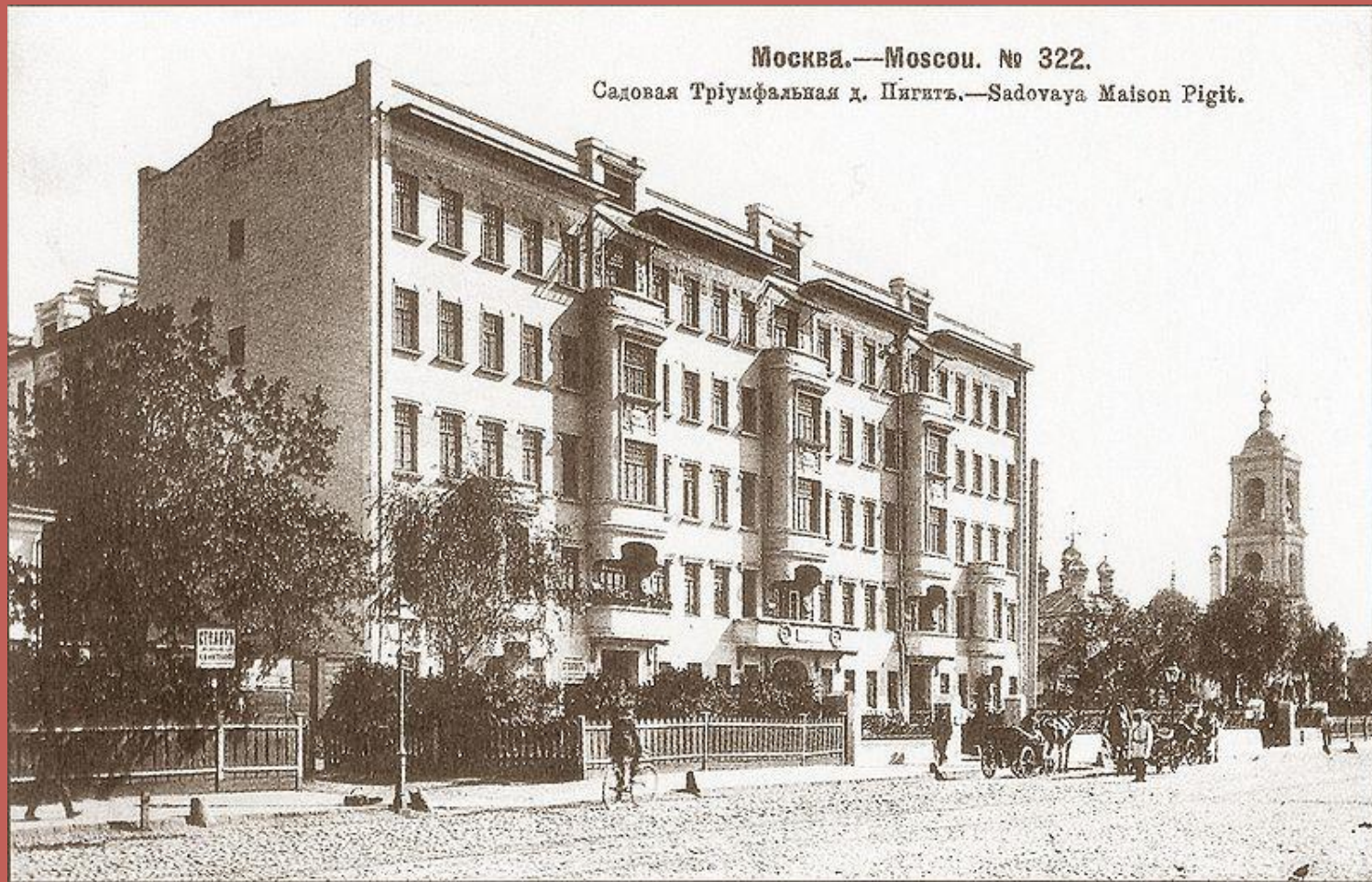
Москва.—Moscou. № 322. Садовая Триумфальная д. Пигитъ.—Sadovaya Maison Pigit.