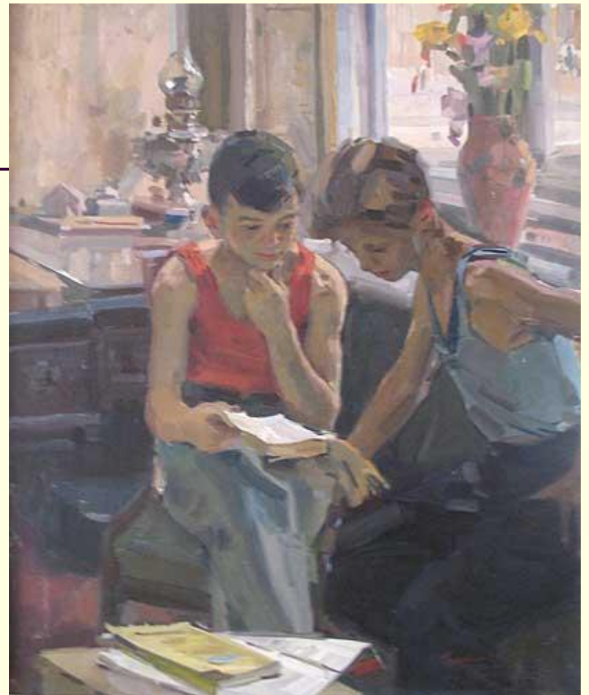
«Друзья-приятели» 1947 год