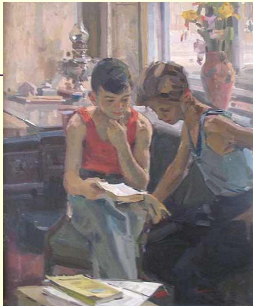
«Друзья-приятели» 1947 год