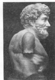
Эзоп — горбатый мудрец. Мрамор. VI в. до н. э. Вилла Альбани.