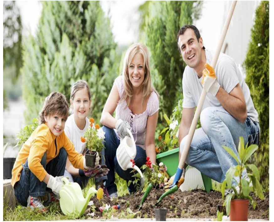
Работает в огороде