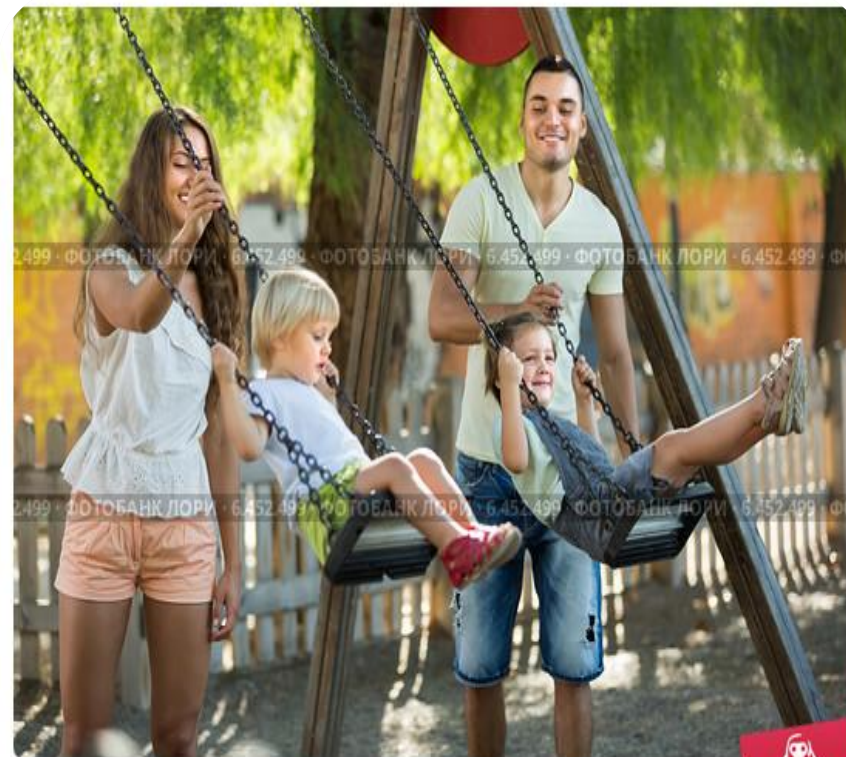
Parents with kids at swings