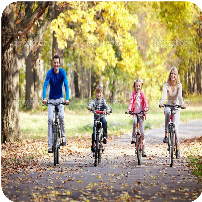
Катается на велосипеде