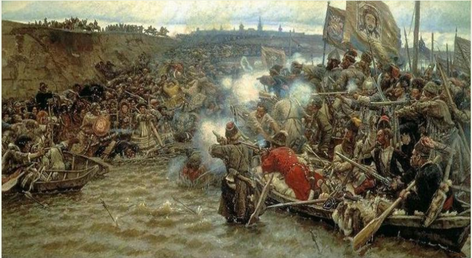
В.А.Суриков. Покорение Сибири Ермаком