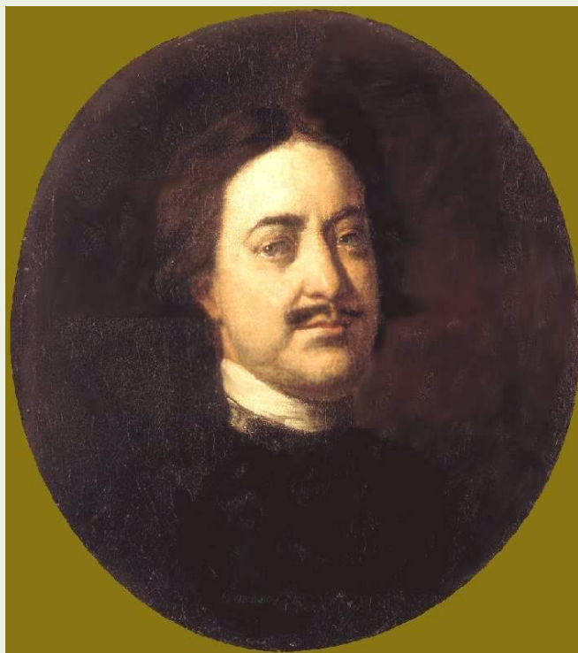
И.Н.Никитин Портрет Петра I