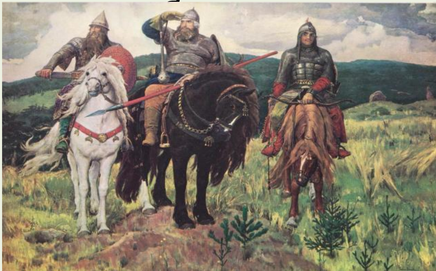
В.М.Васнецов "Богатыри". Холст, масло.1898 г. Третьяковская галерея