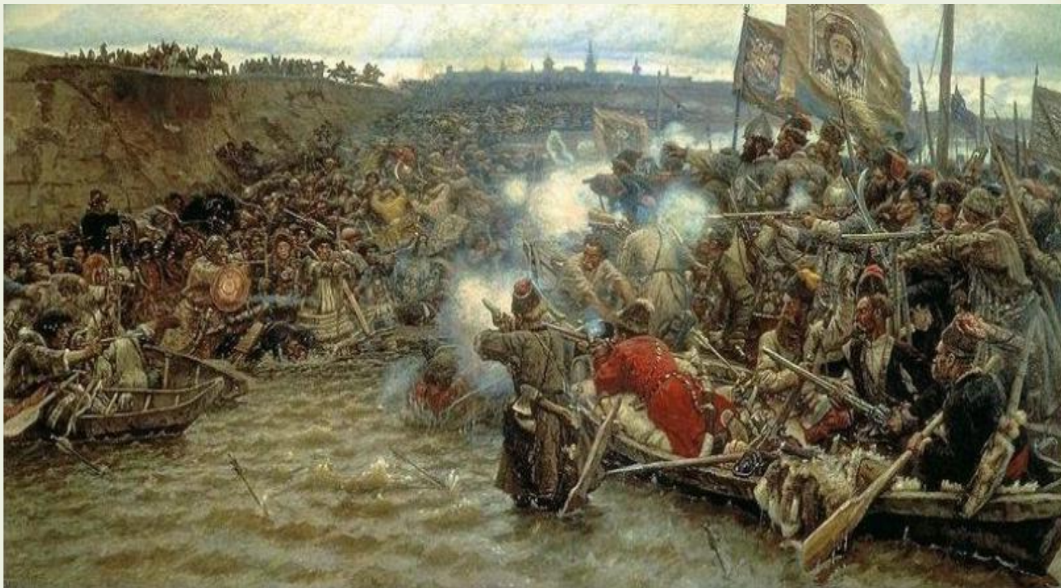
В.А.Суриков. Покорение Сибири Ермаком