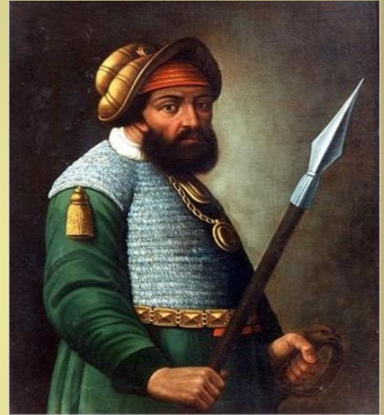
Портрет Ермака Тимофеевича Повольского. Русский художник конца XVII века