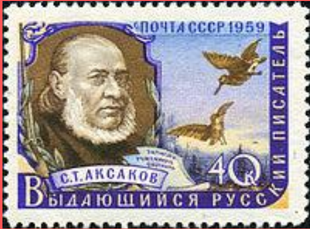
Почтовая марка СССР 1959 год

До середины 1820-х годов театральная критика в периодической печати в Российской империи была под запретом. Аксаков одним из первых оценил талант и значение для русского театра М. С. Щепкина и П. С. Мочалова. Но к концу десятилетия цензурные ограничения стали ослабевать, и конечно, в 1828 г. страстный любитель театра Аксаков после поездки в С.-Петербург опубликовал два «Письма из Петербурга» к издателю «Московского театрального вестника», в которых дал «Вестнику Европы» замечательную сравнительную характеристику о театре и театральном искусстве», а с 1828 по 1830 он становится постоянным театральным высказанным тогда Аксаковым, обозревателем «Московского вестника». С середины 1828 г. по его инициативе при этом журнале выходит специальное «Драматическое добавление», в котором он совмещает деятельность автора и редактора.