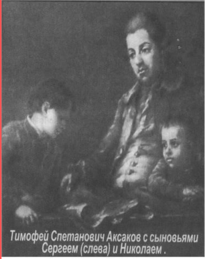
Тимофей Степанович Аксаков с сыновьями Сергеем (слева) и Николаем .

Тимофей Степанович Аксаков по своему положению был простым провинциальным чиновником. Он был мало развит, тих, застенчив, но добр и благороден. Интересы его ограничивались кругом хозяйственных дел, поэтому влияние на умственное развитие сына он оказать не мог, зато от отца писатель унаследовал мягкий нрав, любовь к природе и гуманное отношение к крепостным.