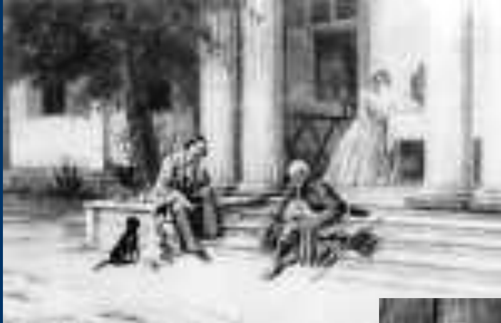
Н.В. Гоголь в Яновщине