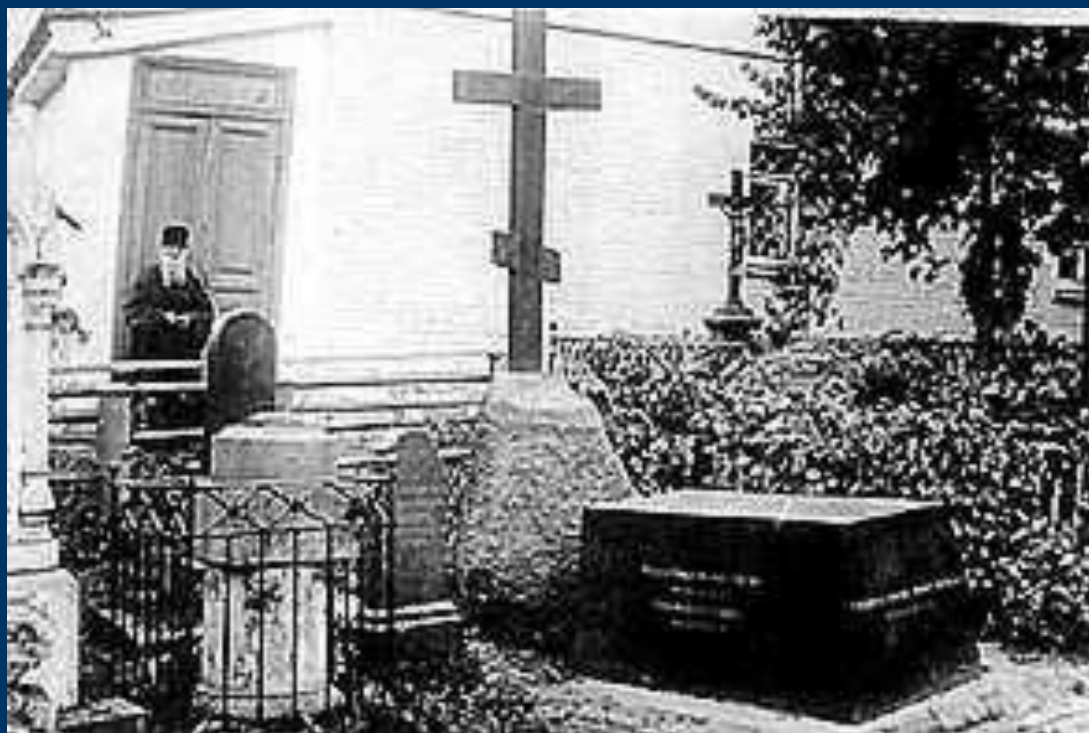
Бывшая могила Н.В. Гоголя в Свято-Даниловом монастыре в Москве

Похороны писателя состоялись при огромном стечении народа на кладбище Свято-Данилова монастыря, а в 1931 останки Гоголя были перезахоронены на Новодевичьем кладбище.