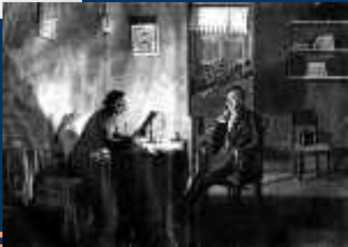
Пушкин у Гоголя