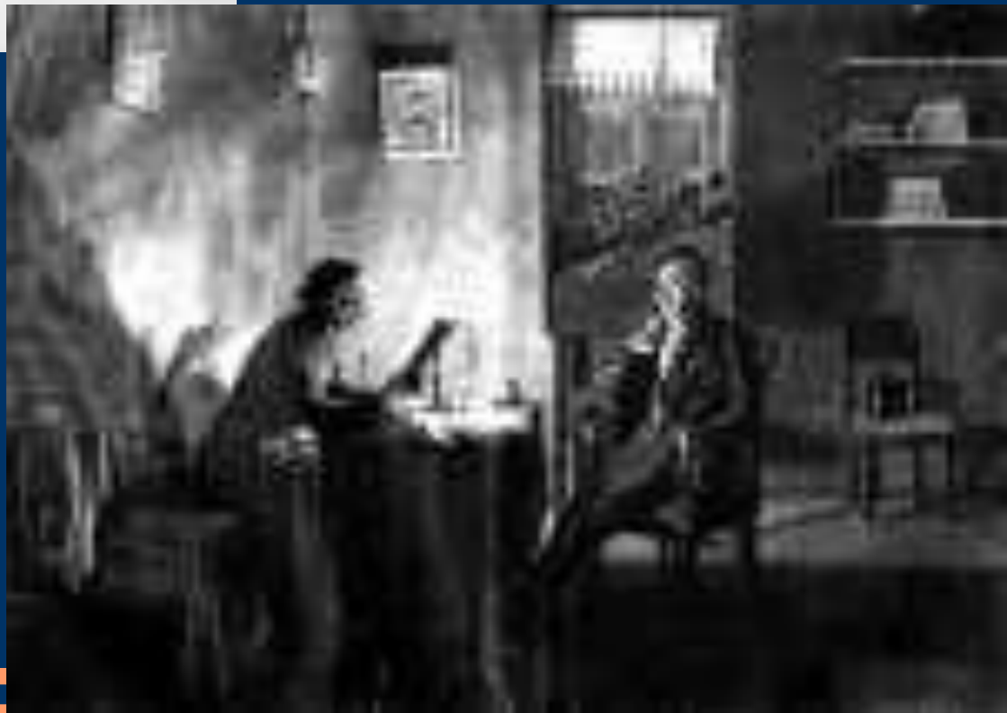
Пушкин у Гоголя