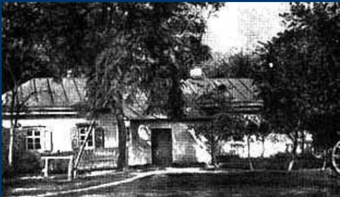
Дом доктора М.Я.Трохимовского в Сорочинцах, где родился Гоголь