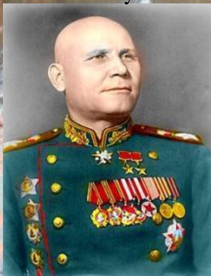
И. С. Конев