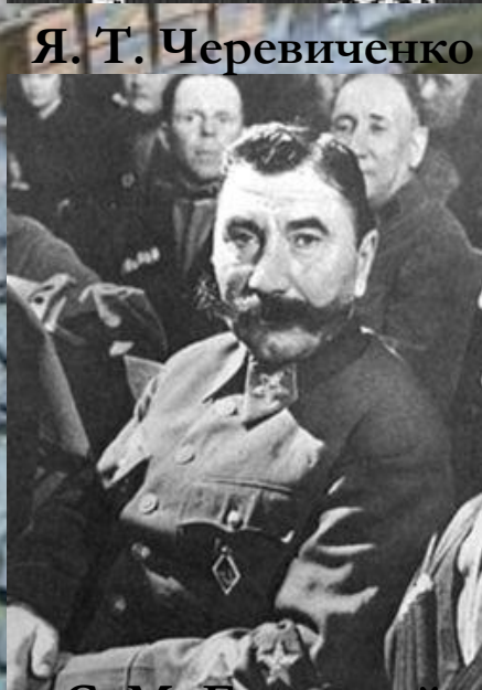
С. М. Буденный