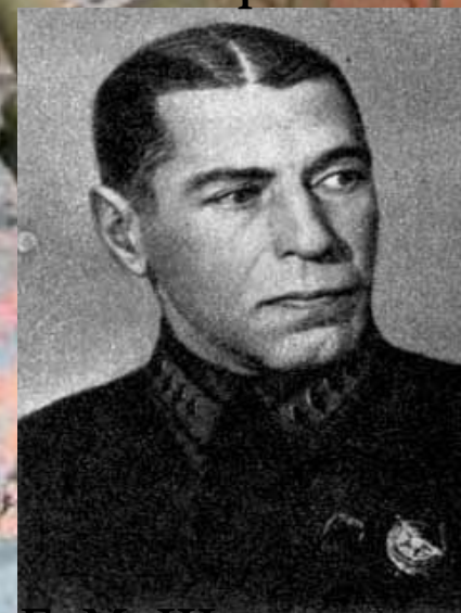
Б. М. Шапошников