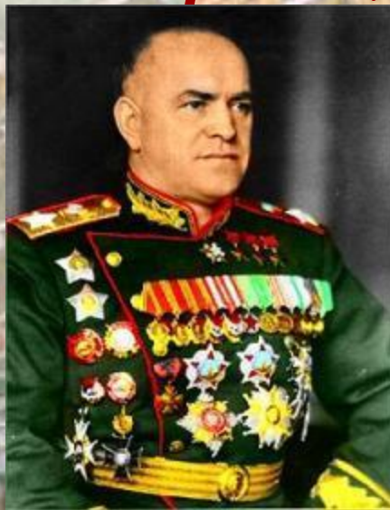
Г. К. Жуков