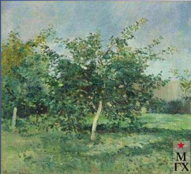
«Яблоневый сад», 1934