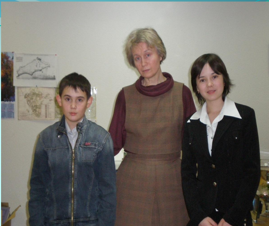
Республиканский конкурс «Моя малая Родина». г. Уфа. Защита исследовательской работы. Диплом. 2008 г.