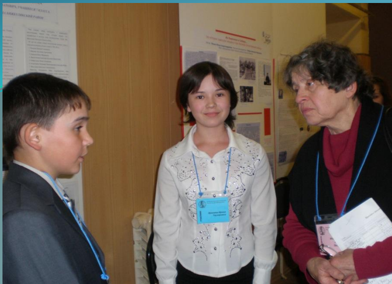
Защита исследовательской работы. г. Москва. Диплом.