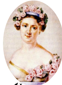
Истомина Евдокия Ильинична