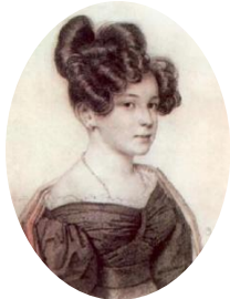
Оленина Анна Алексеевна