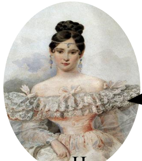
Гончарова Наталья Николаевна