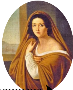
Голицына Евдокия Ивановна