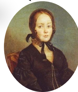
Керн Анна Петровна