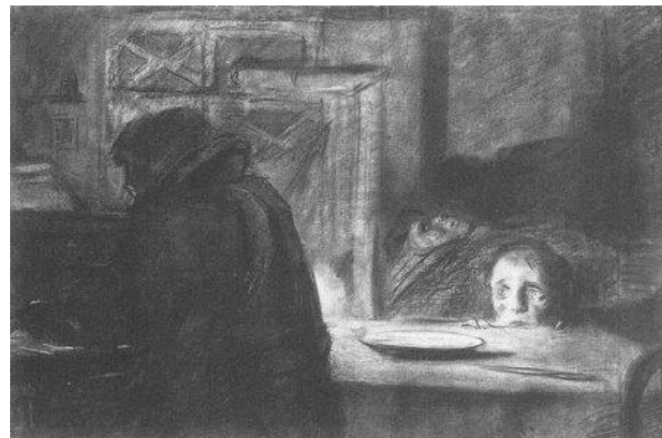
Илья Глазунов. Блокада.

Грузовик по местам проносился горбатым И внимал лейтенант орудийным раскатам, И ворчал, что глаза снегом застит слепящим, Потому что солдатом он был настоящим