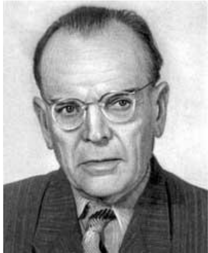
Константин Георгиевич Паустовский (1892-1968), русский советский писатель