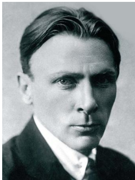
Михаил Афанасьевич Булгаков (1891-1940), русский писатель, драматург, театральный режиссёр и актёр)