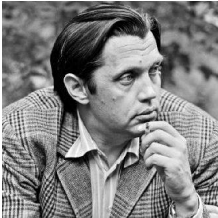
Роберт Иванович Рождественски й (1932-1994) – советский поэт