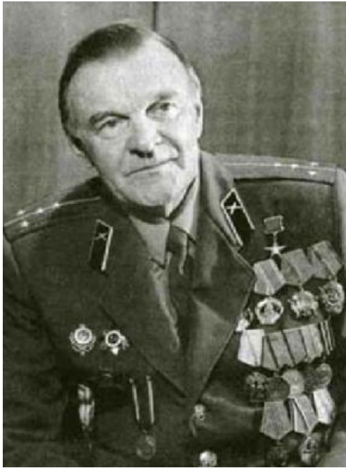
Юрий Васильевич Бондарев (род. 1924) – русский советский писатель, участник Великой Отечественной войны, автор романа «Горячий снег»