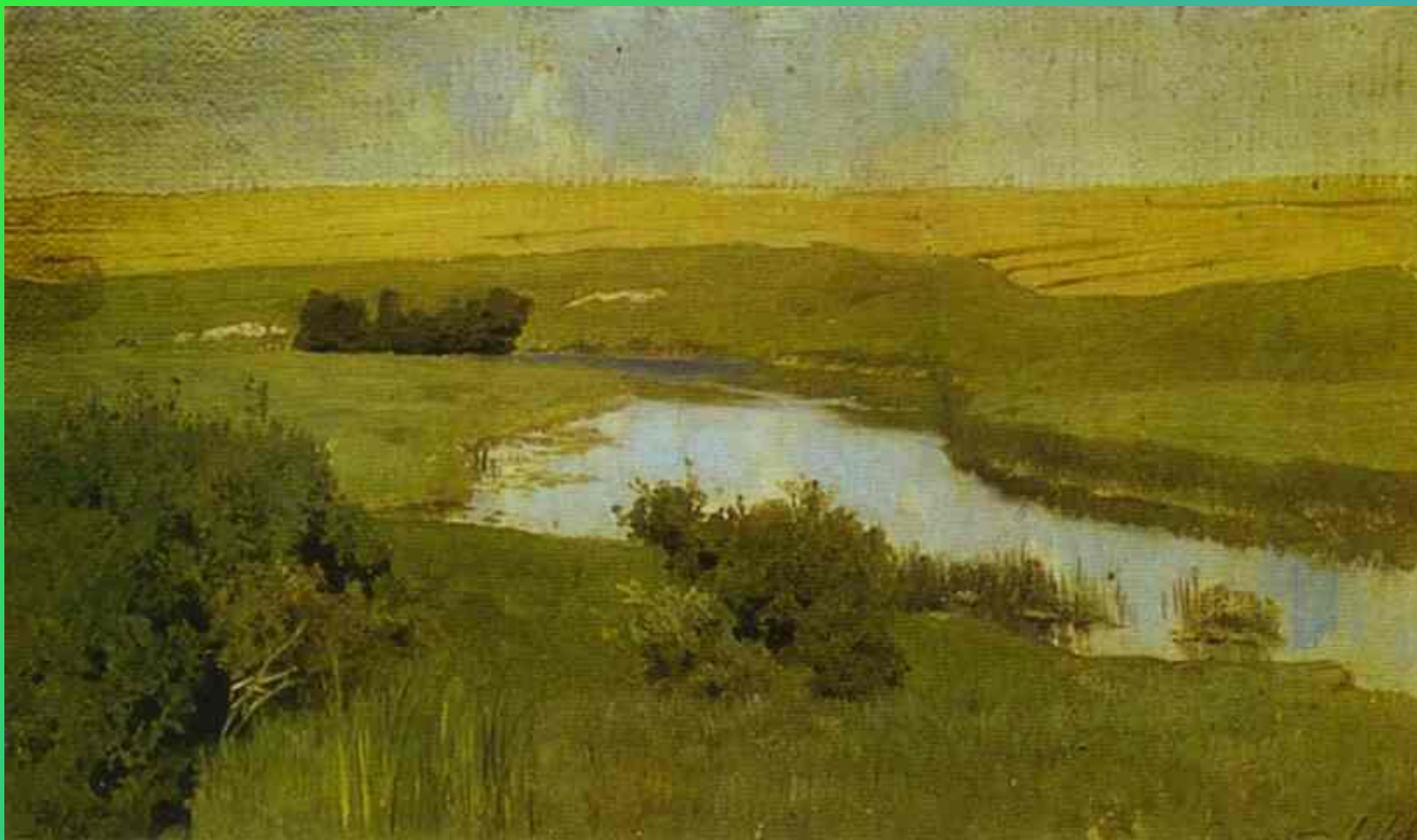
И. Левитан. Речка Истра. 1885-1886