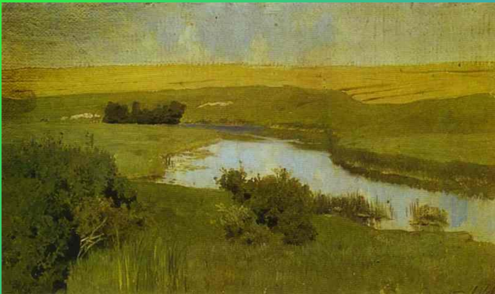
И. Левитан. Речка Истра. 1885-1886