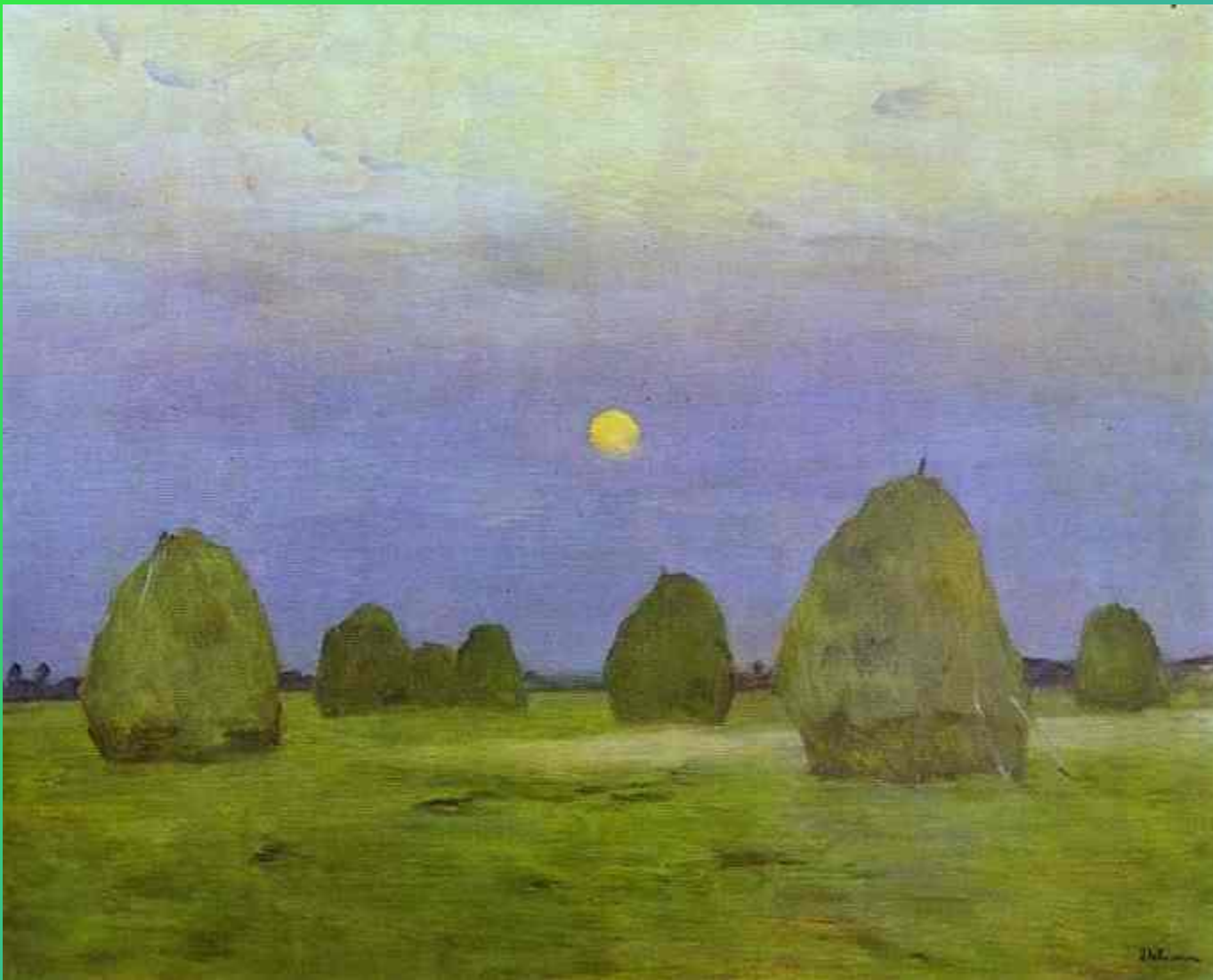
И.Левитан. Стога. Сумерки. 1899