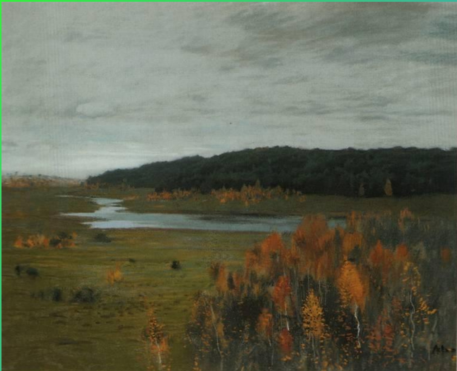
И. Левитан. Долина реки. Осень 1895 год