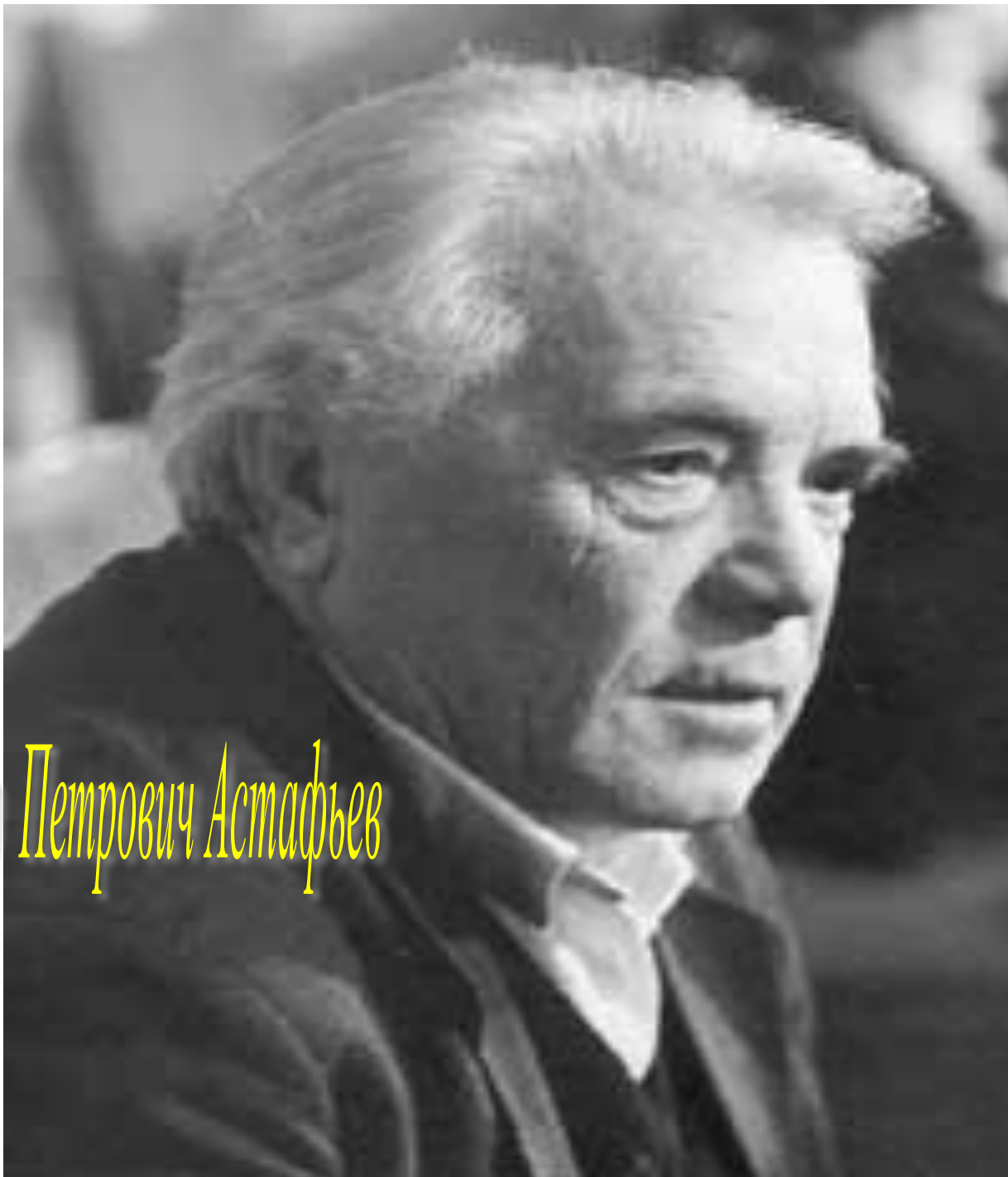
Виктор Петрович Астафьев