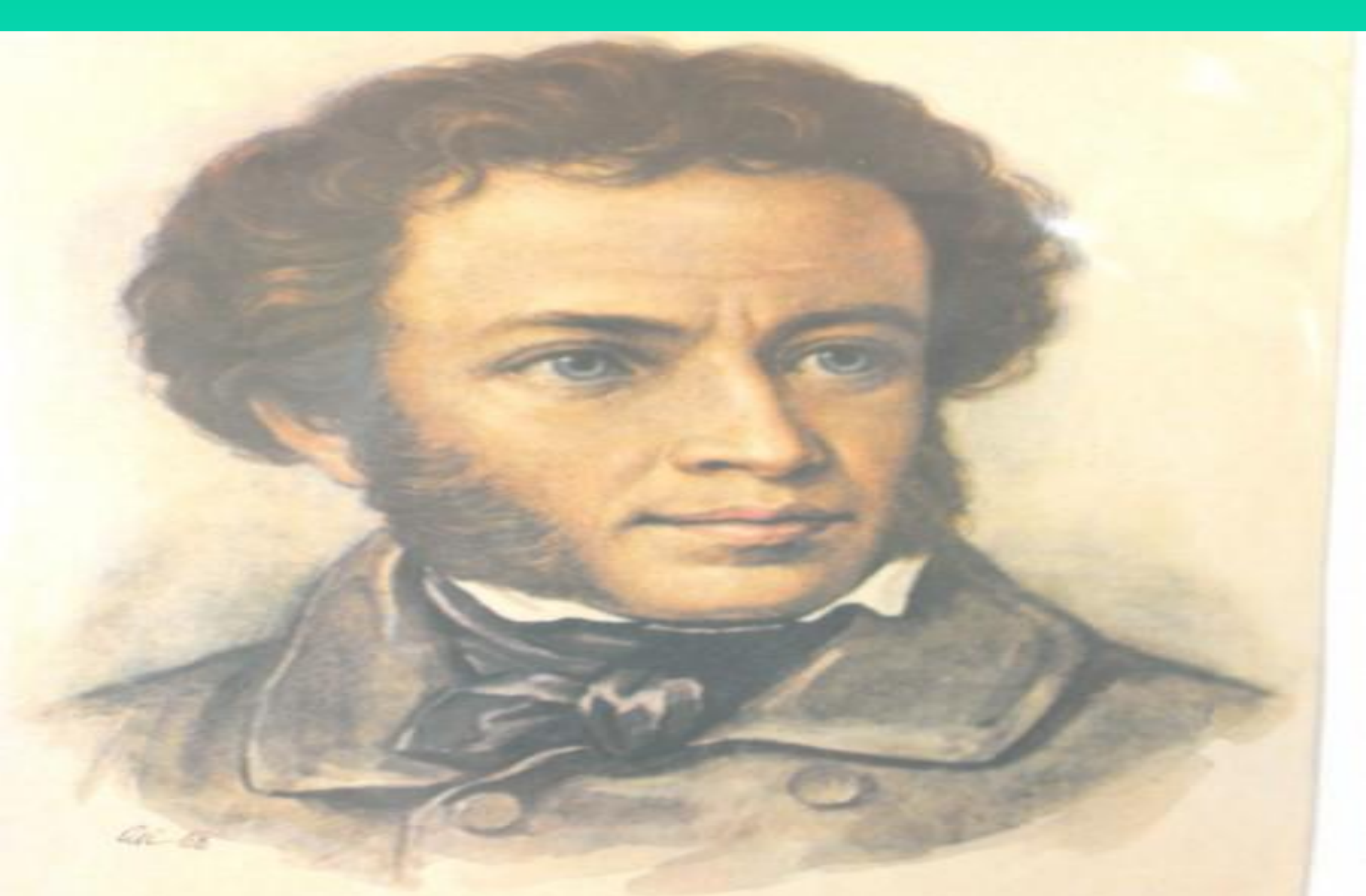
Александр Сергеевич Пушкин (1799—1837)