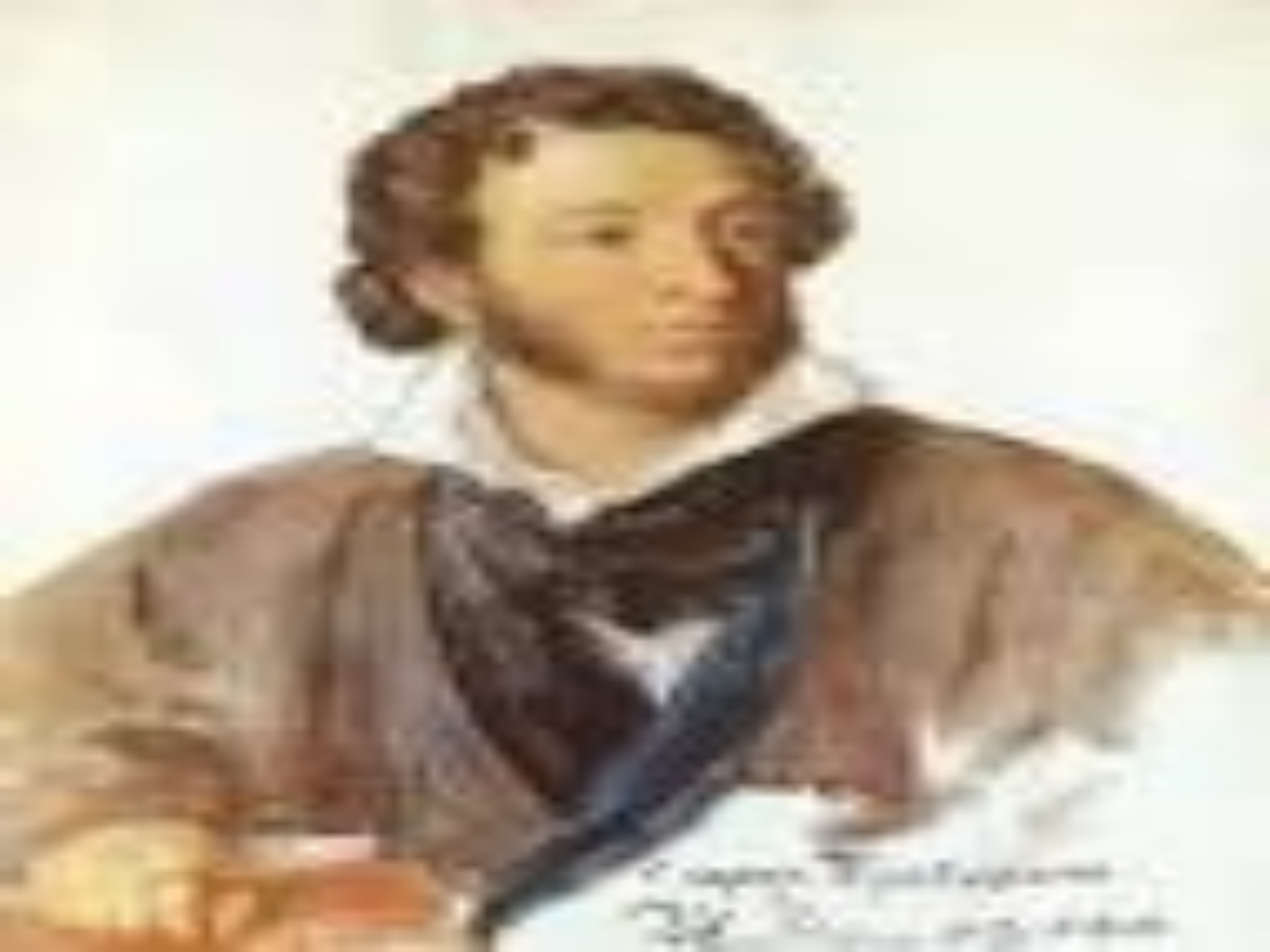
Portrait of a young man, possibly a student or scholar, wearing a brown coat and a blue sash. The image is a reproduction of a painting.